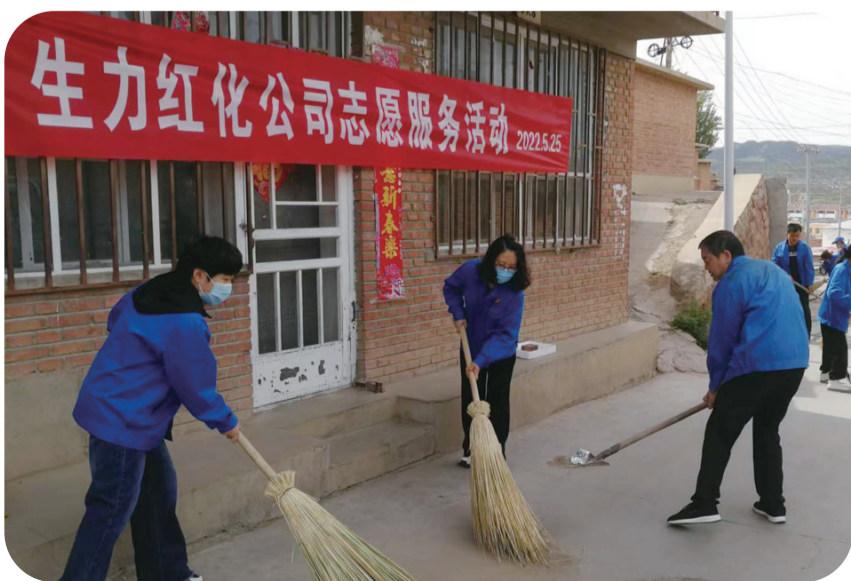
生力红化组织党员干部职工在清水河县花园社区红旗北山家属区开展清卫活动。