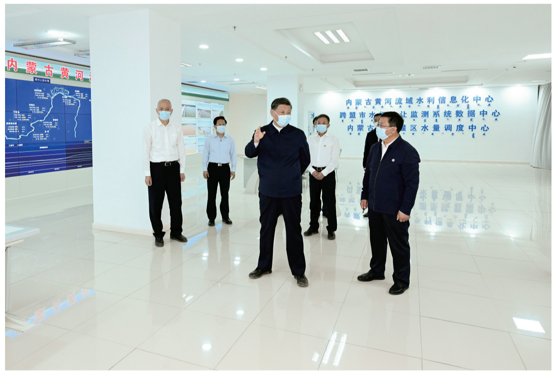
6月5日至6日，中共中央总书记、国家主席、中央军委主席习近平在内蒙古巴彦淖尔考察，并主持召开加强荒漠化综合防治和推进“三北”等重点生态工程建设座谈会。这是6日上午，习近平在河套灌区水量信息化监测中心考察。