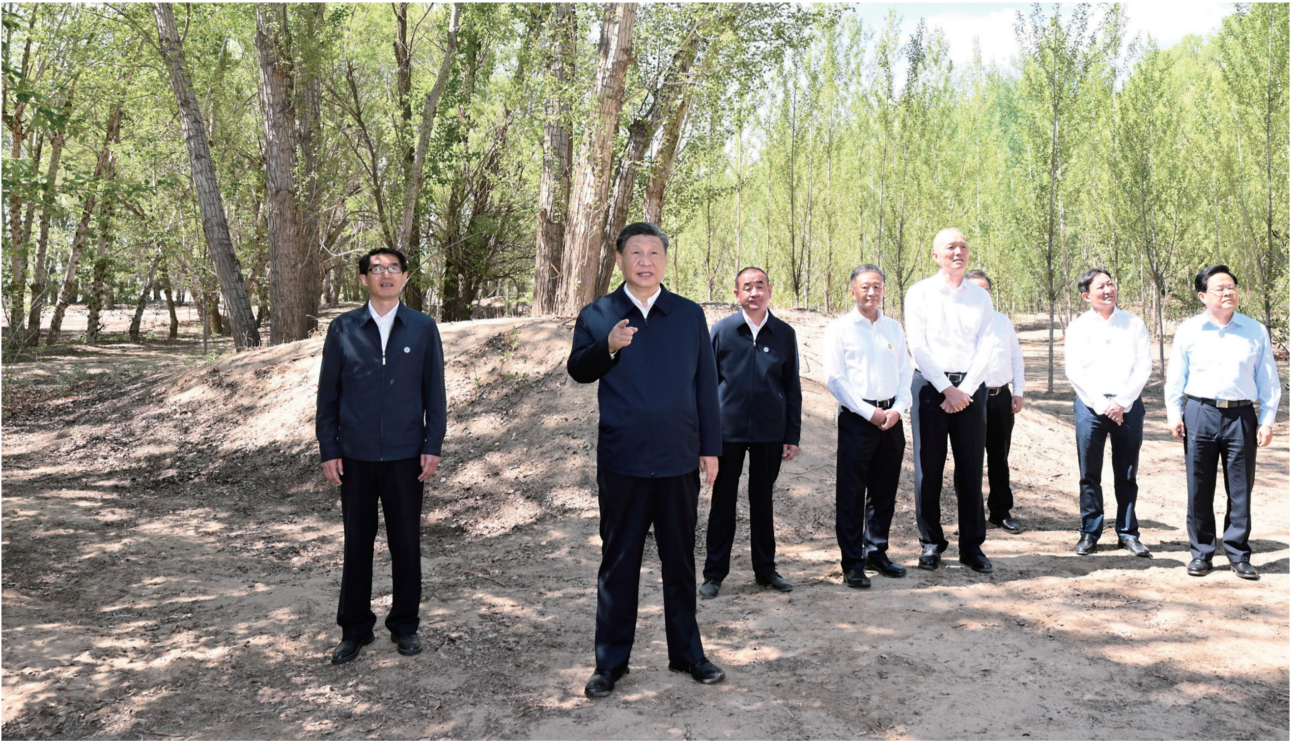
6月5日至6日，中共中央总书记、国家主席、中央军委主席习近平在内蒙古巴彦淖尔考察，并主持召开加强荒漠化综合防治和推进“三北”等重点生态工程建设座谈会。这是6日上午，习近平在临河区国营新华林场考察。