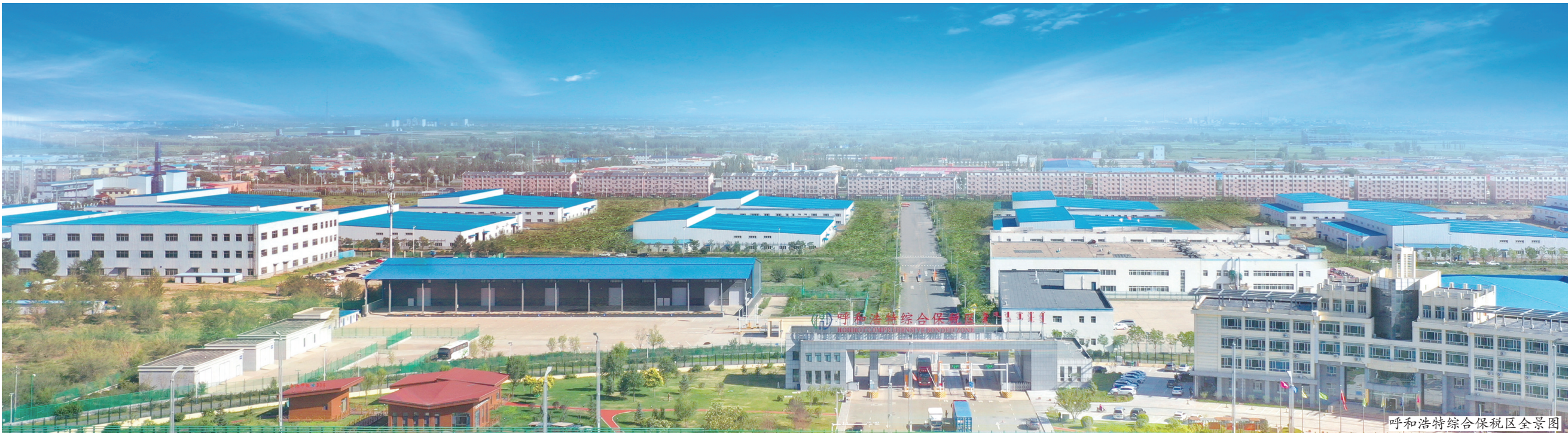
呼和浩特综合保税区全景图

呼和浩特地处京津冀环渤海经济圈腹地,是呼包鄂乌一体化发展重要城市、呼包银榆城市群中心,也是国家向北开放、连接中蒙俄经济走廊的重要枢纽城市,更是一座包容开放的现代化草原丝绸之路枢纽城市。