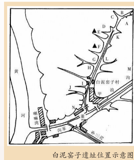
白泥窑子遗址位置示意图

魏坚教授认为白泥窑子遗址中的方唇短沿夹砂碗、深腹盆、敛口瓮等均可在北首岭、元君庙、姜寨等遗址的早期遗存中找到相似的器形,特别是半坡文化所特有的宽带纹彩陶或者素面的圆底钵在这里大量流行。与此同时,以红顶钵和锥状鼎足为特征的后岗一期文化因素也对本