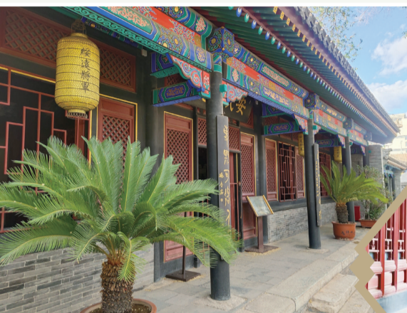
▶游客们身穿古装在将军衙署博物院打卡拍照

制度的产物,作为清朝统治和管理内蒙古地区的重要机构之一,是清代沟通中央和边疆地区联系的重要军事重镇和枢纽机关,它的存在对见证各民族共同守卫祖国边疆、共同创造美好生活、民族团结、形成中华民族共同体意识起到不可替代的作用。