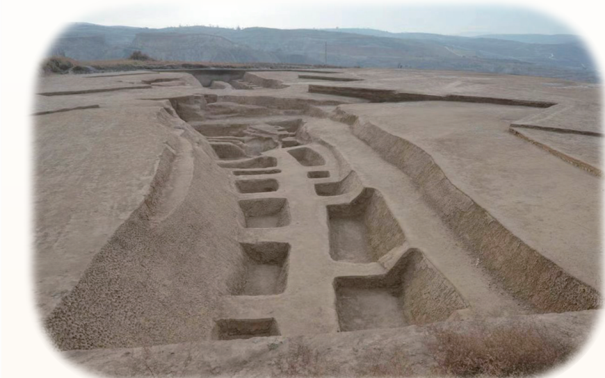
岔河口聚落遗址南门西侧沟

黄河是我国的母亲河，之所以有这一称呼，可以追溯到距今10000年前的新石器时代早期。此时，呼和浩特地区的史前人类得益于暖湿气候的转变，也就是“仰韶文化温暖期”的到来，摆脱了单纯从自然环境进行采集渔猎的模式，由食物的获取者开始成为食物的生产者，原始农业开始迅速发展，人类文明也步入辉煌发展的新阶段，仰韶、龙山时代人类遗址遗迹也更加丰富。在清水河县就存在这样一处遗址——岔河口聚落遗址，她完整地呈现了呼和浩特地区早期人类文明从交流交往到繁荣发展直至衰落的总体历程。