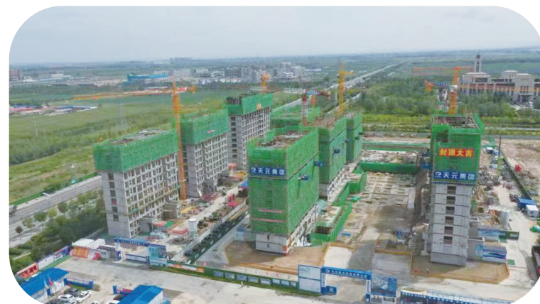
保障性租赁住房建设项目