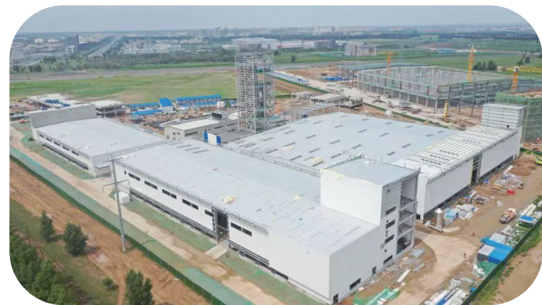
科拓生物微生态制剂生产基地