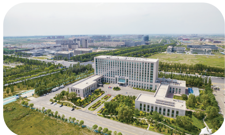
中国电信云计算内蒙古信息园