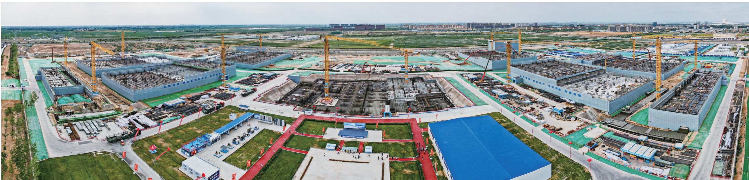
中国农业银行内蒙古数据中心

下一步,和林格尔新区将牢固树立“产业先行、项目为王”的理念,咬定青山不放松,全员抓招商、全力抓落地、全程抓服务,全力打造数据中心集群产业链、半导体芯片产业链、人力资源服务产业链、临空经济产业链、基础设施和公共服务配套体系“四链一配套”,确保超额完成“全年实施重点项目数和完成投资额继续实现‘双一百’”目标任务,为全市高质量发展作出更大贡献。