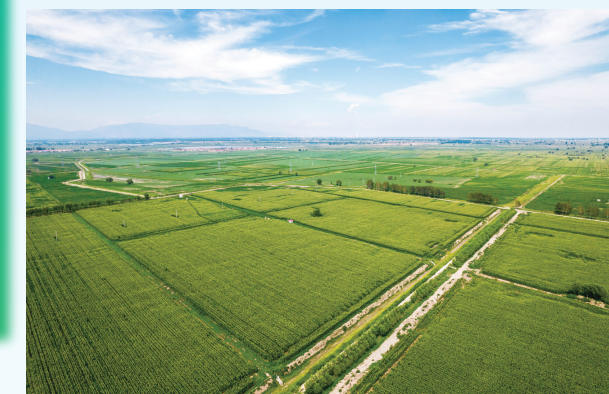
正时农业第十农场(塔布赛基地)