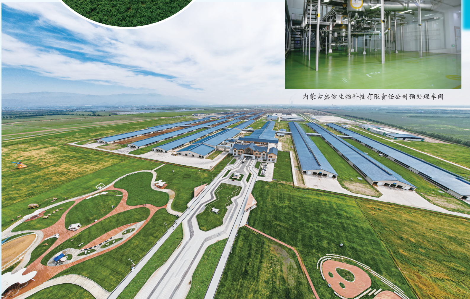
俯瞰敕勒川生态智慧牧场