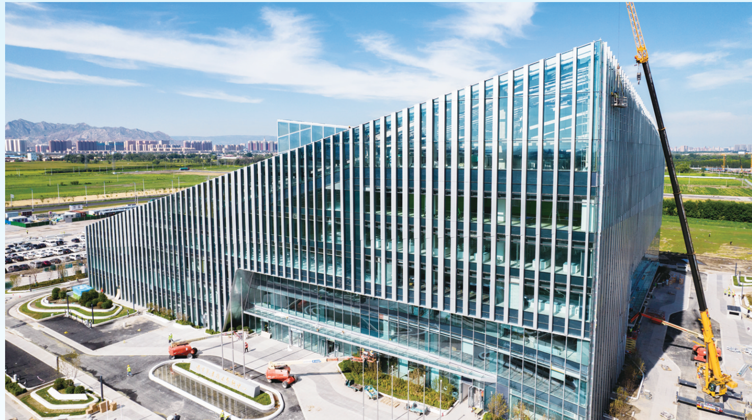
正在建设中的国家乳业技术创新中心

8月4日至7日,世界奶业大会将在我市举办。此次奶业大会将系统展示近年来奶业振兴的创新实践,分享呼和浩特市、内蒙古乃至全国奶业发展的经验成就,同时为全球顶尖企业、专家学者搭建起对话的平台,建立起沟通合作的机制,共同推动探索新时代奶业绿色可持续发展的新模式、新路径,全面落实国家奶业振兴战略,打造“中国乳都”升级版。近年来,我市围绕“育好种、种好草、养好牛、产好奶、建好链”的全产业链发展思路,下大力解决好草源、牛源、奶源等“卡脖子”问题,加快国家乳业技术创新中心投用,积极争创国家草业技术创新中心,推动由“中国乳都”向“世界乳业科技之都”迈进。