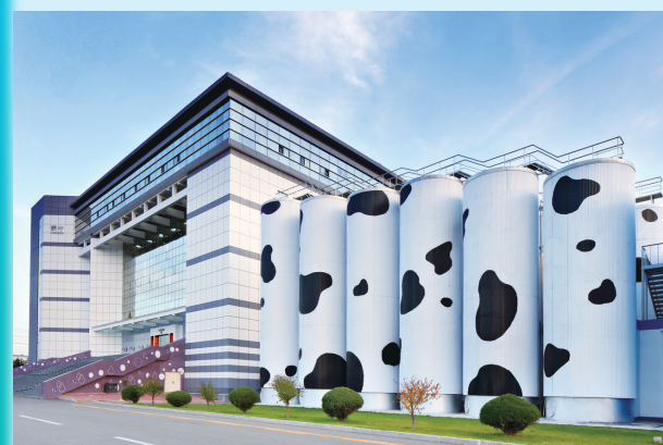
蒙牛和林总部六期工厂