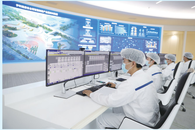
伊利现代智慧健康谷智控中心