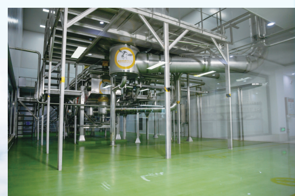
内蒙古盛健生物科技有限责任公司预处理车间