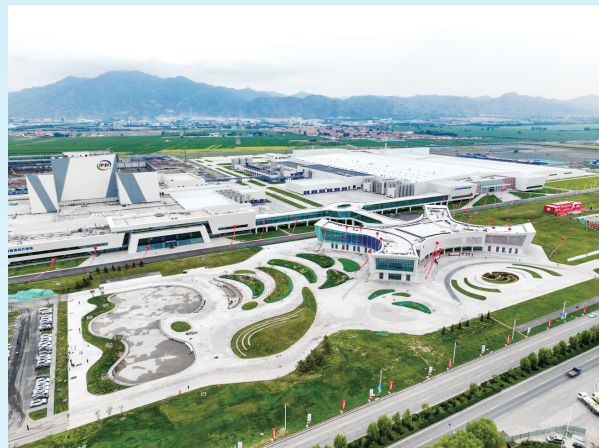
俯瞰伊利现代智慧健康谷