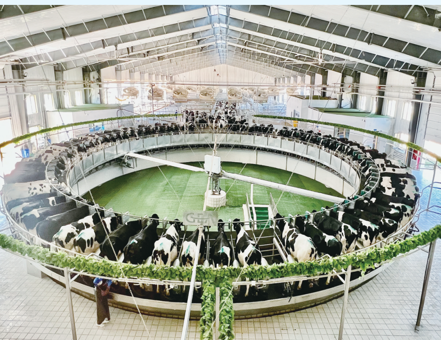
赛科星清水河奶牛核心育种场的挤奶大厅