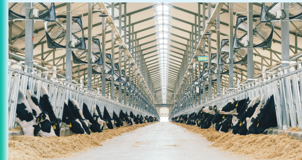
敕勒川生态智慧牧场