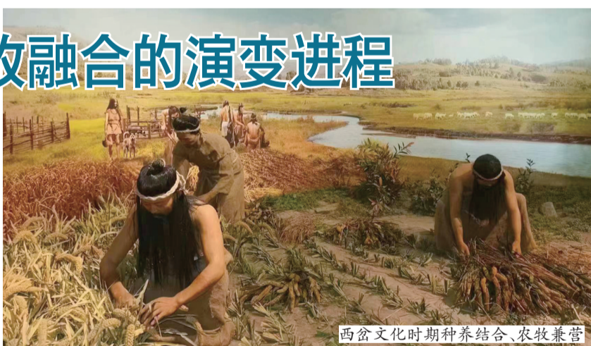
西岔文化时期种养结合、农牧兼营