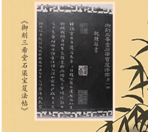
《御刻三希堂石渠宝笈法帖》