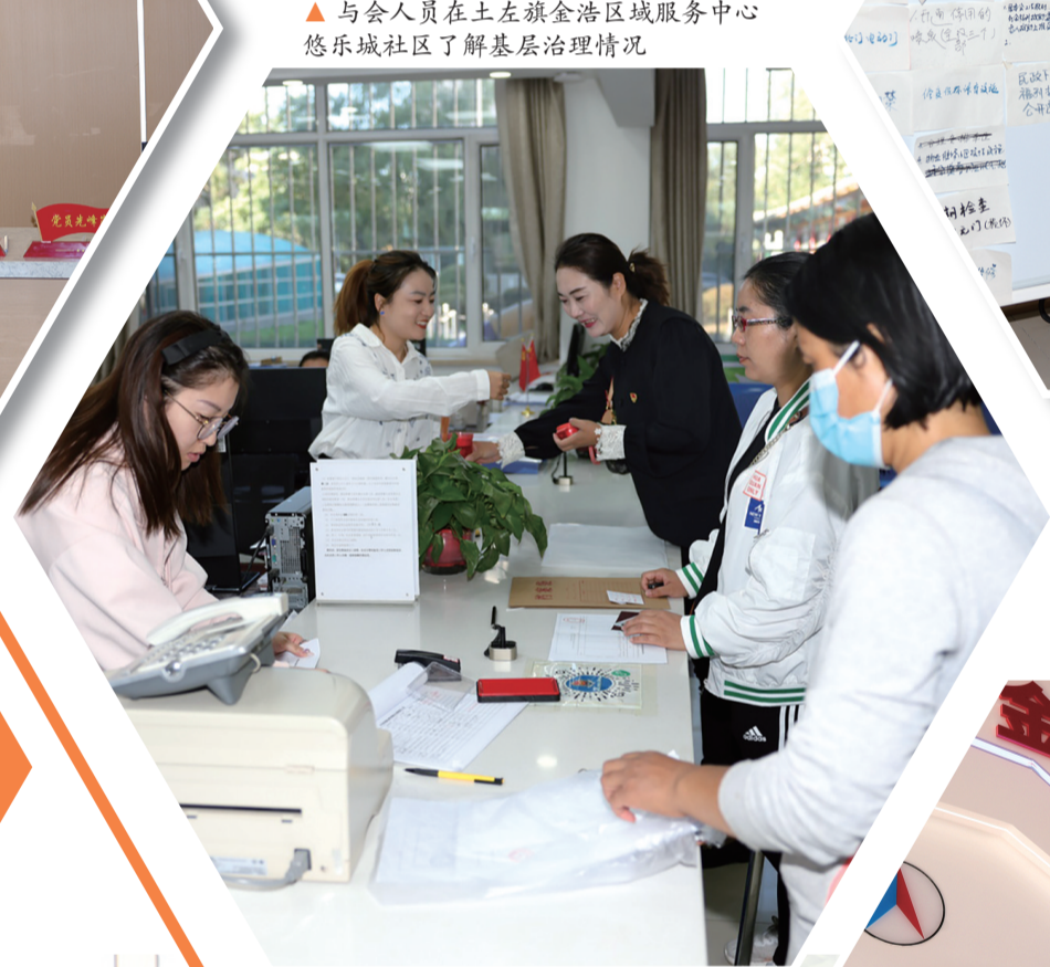
▲ 与会人员土左旗金浩区域服务中心悠乐城社区了解基层治理情况