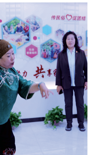
▲ 清泉街社区观摩现场演员表演二人台《夸党的好政策》