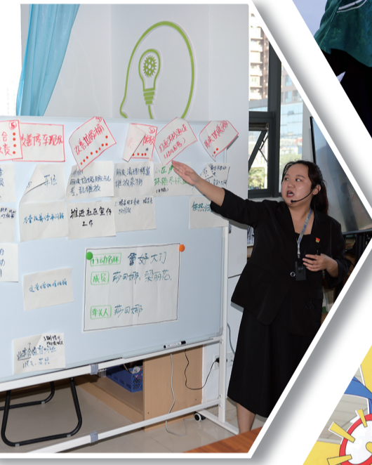
▲ 展板上张贴的丽城社区在基层治理中收集到的群众建议