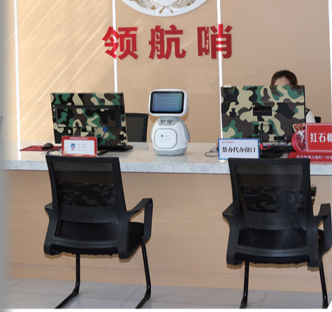
▲ 军区社区设置的领航哨