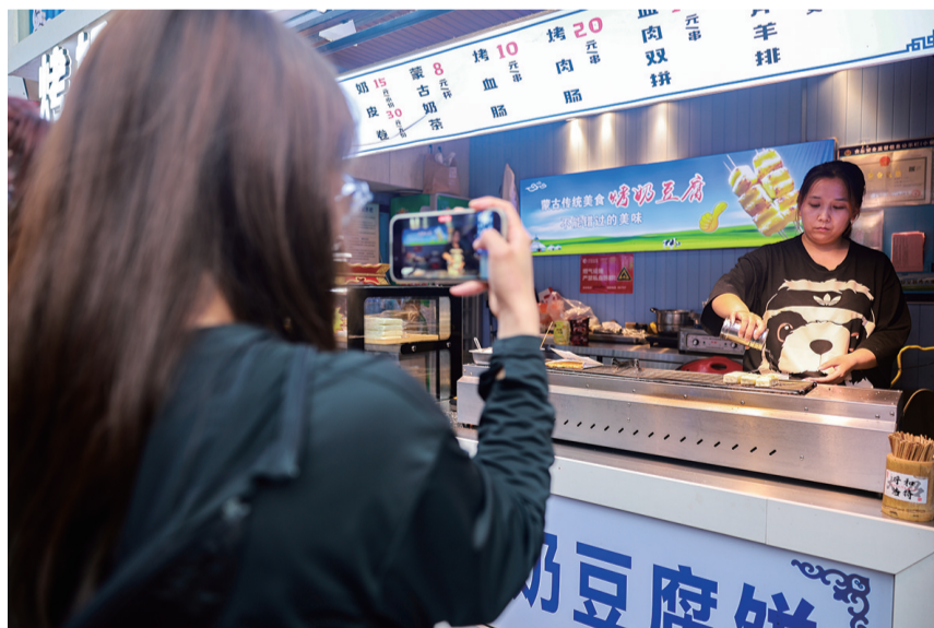
拍张特色美食烧烤发朋友圈

呼和浩特夏季的夜,清凉舒爽的晚风轻轻拂过,忙碌了一整天的人们,此时纷纷放慢脚步,沉浸于那独特的夜生活模式之中。漫步街头巷尾,感受城市脉搏,那十足的烟火气息和激情四溢的活力,仿佛为这座城市的夜晚描绘出一幅绚烂的画卷。灯火辉煌的霓虹灯下,人们欢声笑语,尽享此刻的惬意,让身心得到放松。