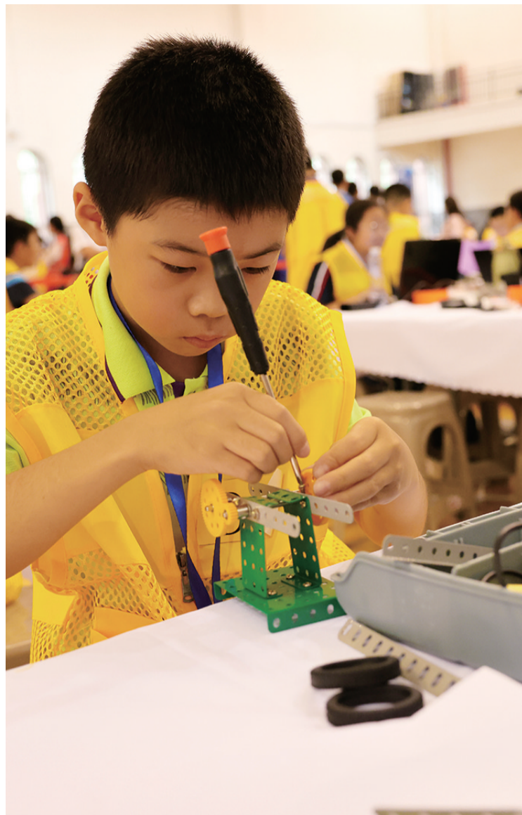
小选手认真制作参赛作品

大赛的成功举办,不仅为青少年搭建了一座通往科技殿堂的桥梁,也为更多向往人工智能的青少年提供了一个了解、学习的平台。