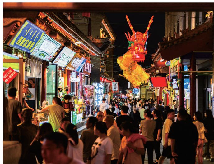
◀熙熙攘攘的通顺大巷 ▼夜晚的塞上老街旅游休闲街区人流如织