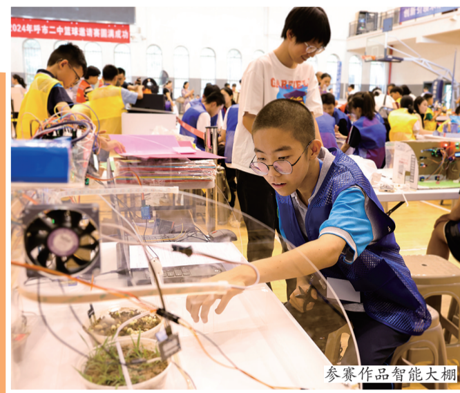
参赛作品智能大棚