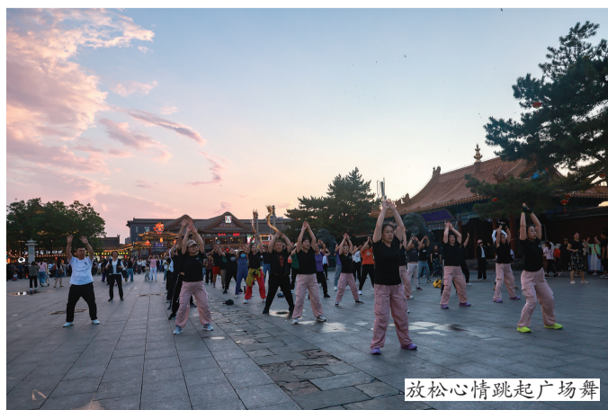
放松心情跳起广场舞