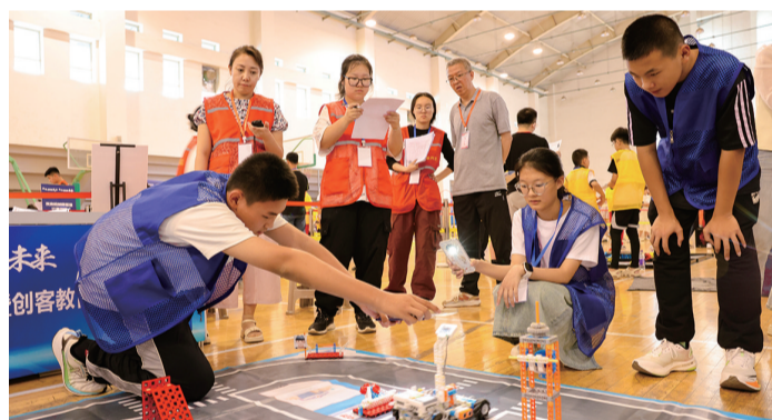
▲未来机械师搭建赛 ▶星际救援竞赛