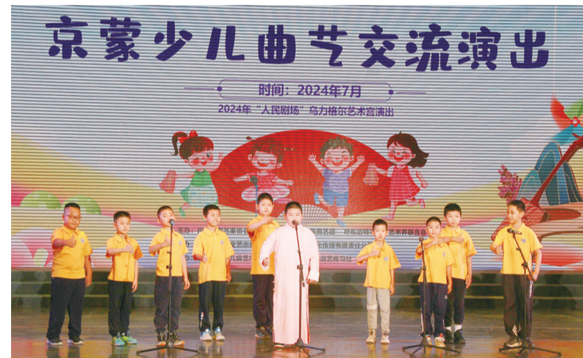
7月9日，京蒙少儿曲艺交流演出在呼和浩特市乌力格尔艺术馆举行。演出精彩纷呈，来自北京和内蒙古两地的小朋友轮番亮相，同台表演，充分展示了京蒙两地曲艺事业传承和发展所取得的丰硕成果。

本次京蒙少儿曲艺交流演出不仅是一次传承和弘扬中华优秀传统文化的生动实践，也搭建起了京蒙两地少儿曲艺交流互动的平台。