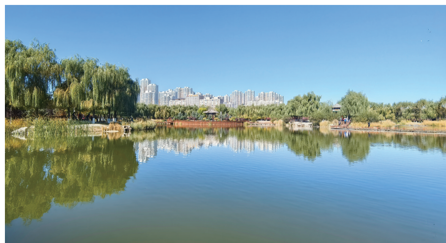
草原丝绸之路文化公园

“风吹一片叶，万物已惊秋。”如果说春夏是花的时节，那秋冬就是草木人间。周末闲暇时，不妨和家人一起走出家门，享受如同彩叶般热烈的美好生活。