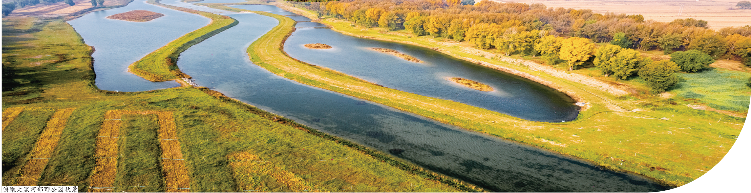
俯瞰大黑河郊野公园秋景