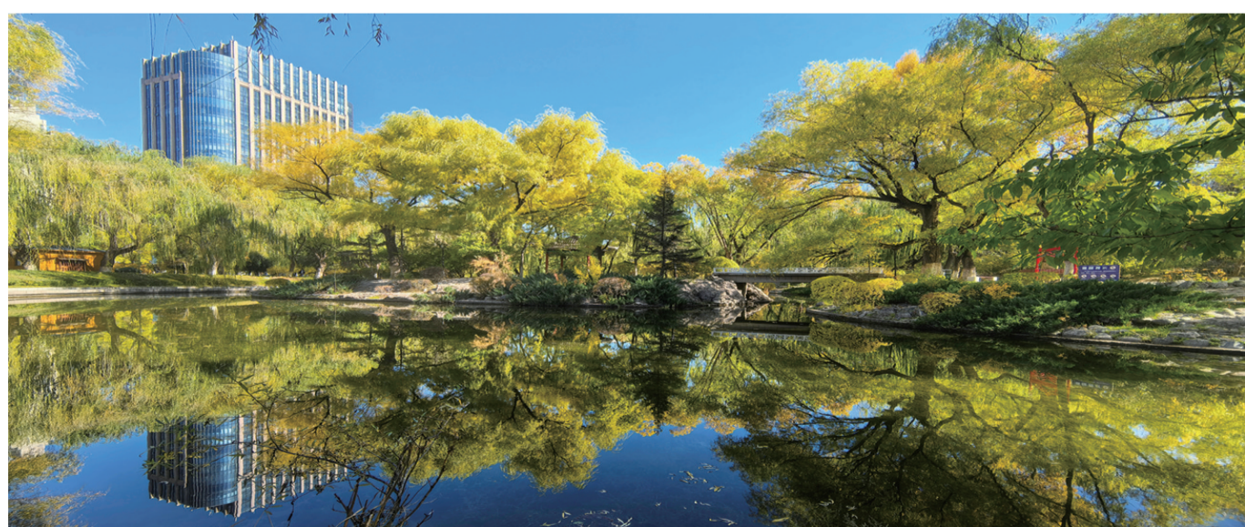
满都海公园景色如画