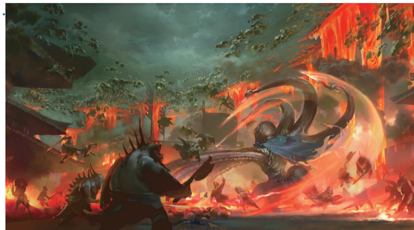
这是影片中陈塘关大战的前期概念图。

觉效果提升,更在于将传统文化与现代技术有机结合。”四川传媒学院数字媒体与创意设计学院教授黄丹红举例,莲藕肉身塑造的场景中,荷花与荷叶的东方美学气息通过3D技术得以生动呈现。这种融合不仅提升影片艺术价值,也为中国动画电影发展提供了新思路。 ——更新颖的形象,让故事表达深入人心。 影片中,哪吒的“烟熏妆”、小动作,乃至口中的打油诗等,很快吸引了一批青少年“粉丝”;太乙真人被设计为一位会说四川方言、带有喜剧色彩的角色;土拨鼠、虾兵蟹将等形象同样丰富多彩。 为了保证人物形象准确、画面细节完整,影片70%以上的戏份,饺子都自己演了一遍。经过导演的演绎,动画师能更精准地捕捉表演的层次感。 片中,无量仙翁喝完甘露后皱了皱眉头,这个动作看似平平无奇,实则增加了紧张氛围,让观众误以为无量仙翁尝试突破。这个细节灵感就来自导演的表演。饺子介绍,无量仙翁被捉弄还不自知,这样的细节既让观众一笑,又能在逻辑上自洽。 “影片角色塑造不扁平单薄,而是丰富立体。”中国传媒大学动画与数字艺术学院教授范敏说,“例如,申公豹因亲人申小豹到访,内心温情的一面被唤醒;误以为龙族屠杀陈塘关的哪吒虽然满腔愤怒,也要先拯救旧友敖丙;各类小妖的形象也都生动鲜活。” ——更丰沛的情感,引发观众广泛共鸣。 一位天性顽劣的混世魔王,成长为保护陈塘关百姓挺身而出的英雄,哪吒发生这种转变的驱动力是什么?透过故事情节可以发现,影片给出的答案是亲情的力量。 不同于《封神演义》和《哪吒闹海》,《哪吒之魔童闹海》把李靖和殷夫人刻画为一对严父慈母的形象。影片片段,殷夫人用自己的牺牲帮助哪吒重生,更是成为哪吒性格转变的关键因素。 打动人心,不止有亲情。为了让不同年龄段的观众都能产生共鸣,影片全面打磨角色关系,从不同层面增进观众的共情。 太乙真人和哪吒间的师徒情、申公豹和申小豹间的兄弟情、敖丙和哪吒间的友情等,都让影片具有了更加广泛的情感力量,打通了电影和观众的情感连接,让观众产生更多共鸣和感动。 “传统IP能传承这么久,一定存在存在的理由和价值。我们把它价值提炼出来,再结合当下的时代精神,重新创作出一个大家真正相信的故事,希望体现一种时代性。”饺子说。