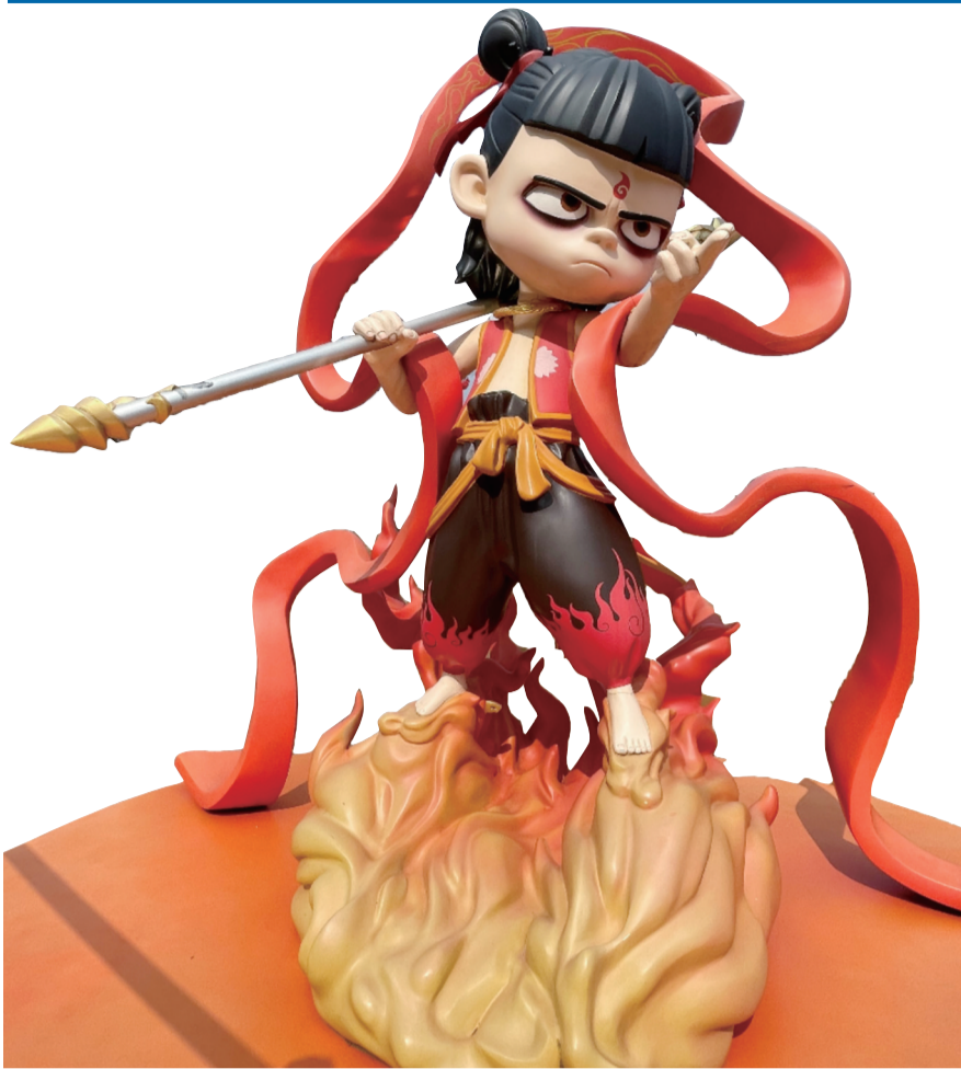
这是位于成都高新区的哪吒雕像(资料照片)。

哪吒,一个脚踏风火轮、手持乾坤圈、腰缠混天绫的3岁孩童,中国人再熟悉不过的神话人物,在2025年新春伊始,频创神话。从2月7日登顶全球影史单一市场票房榜,到2月13日票房突破百亿元,再到2月15日票房突破110亿元排名全球票房榜第11位,电影《哪吒2》实现了我国电影史上的历史性突破,现象级票房更带来一连串文化冲击波。 《哪吒2》风靡全球的背后,凝聚着4000余人主创、近140家中国动画公司、2000个日夜的创意和心血。以导演饺子为代表的创作团队拧成一股绳,创出一条路,展现着中国国产动画的“新势力”。 从“我命由我不由天”,到“若前方无路,我便踏出一条路”。台词道出的,是电影创作的文化自信,彰显中国人勇敢、无畏的精神力量。“哪吒”何以“炼”就?