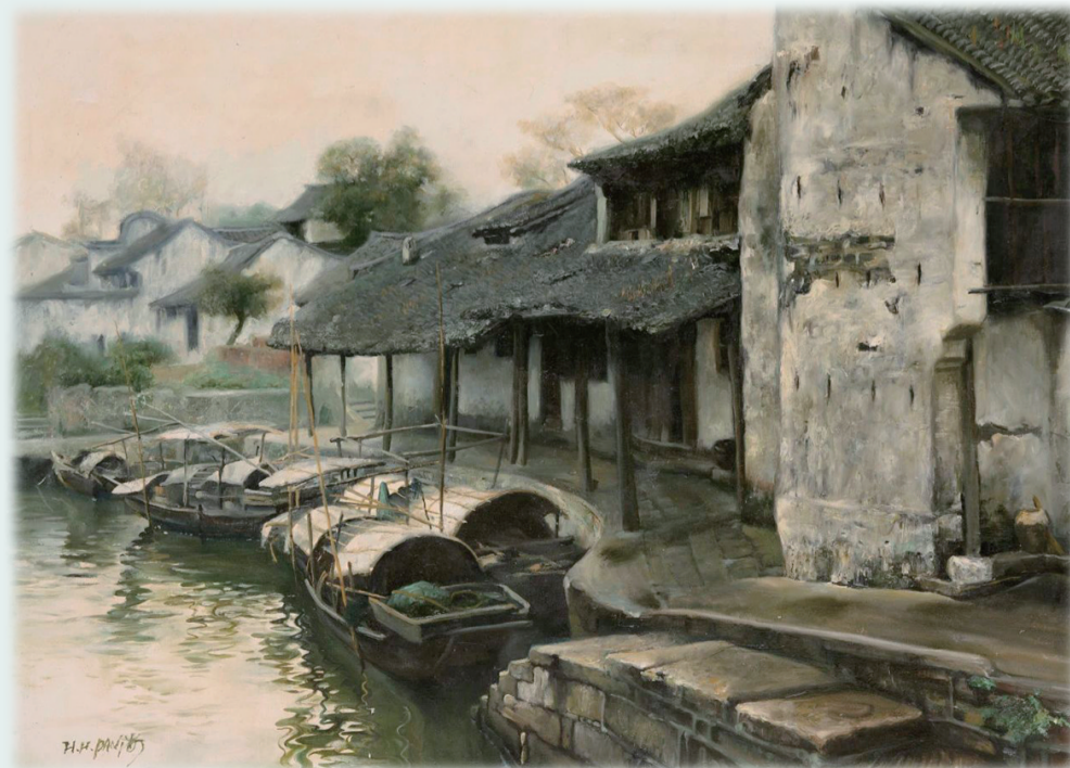
《泊》1990年 80×101cm 浙江美术馆藏