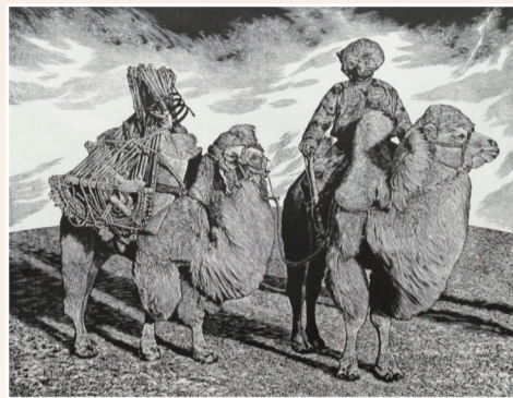
《远方》黑白木刻 82×108cm 2019年入选“第二十二届全国版画展”