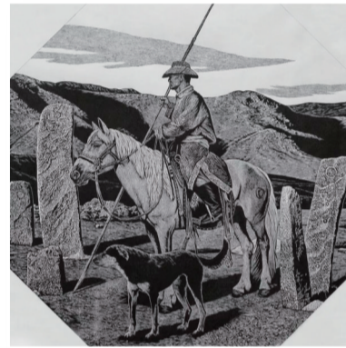
《蓝色高原——听风》黑白木刻 90×90cm 2020年第十四届全国美展入选作品

德力格仁贵,蒙古族,1971年4月出生在内蒙古通辽市。1996年毕业于内蒙古师范大学美术系版画专业,获学士学位。现为中国美术家协会会员,内蒙古美术家协会版画艺委会副主任,内蒙古当代美术学会副会长,内蒙古美术馆专家委员会成员,内蒙古艺术学院美术学院版画系主任,副教授。版画作品多次参加各类学术展览并在美国、俄罗斯、英国、瑞典、蒙古、韩国等国家展出。作品《生命》获中国美术最高奖“第二届中国美术金彩奖”优秀奖;作品《蒙古高原》获“第二十届全国版画展”中国美术奖提名(最高奖);作品《文明的印记》入选“第十一届全国美术作品展”;作品《蒙古高原》入选“第十二届全国美术作品展”;作品《塬上行》入选“第十三届全国美术作品展”;作品《蓝色高原——听风》入选“第十四届全国美术作品展”;作品《忧郁城堡》入选“第十三届全国版画展”;作品《乌珠穆沁人之二,阿爸》入选“第十六届全国版画展”;作品《远方》入选“第十六届全国版画展”;作品《月夜》入选“第二十二届全国版画展”;作品《月夜》入选“第二十三届全国版画展”;作品《塬上行》入选“大道有痕·2018中国百家金陵画展(版画)”;作品《科尔沁的深秋》入选“二十一世纪首届中国黑白木刻展览”。