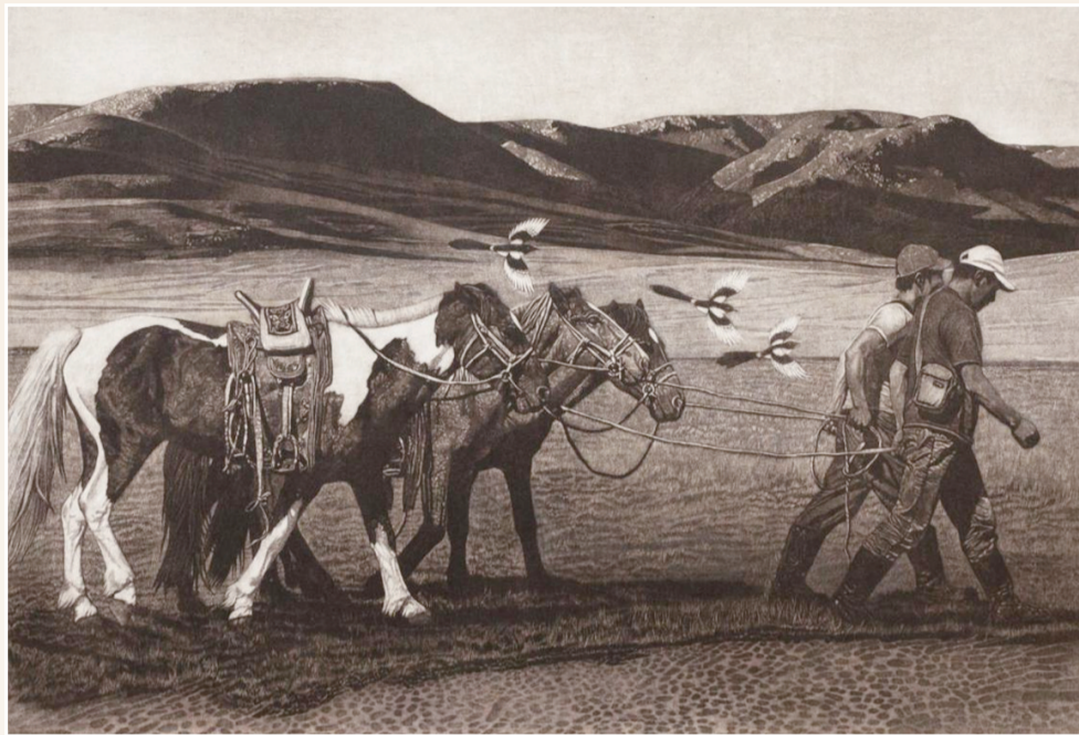
《塬上行》铜版 51×75cm 入选“第十三届全国美术作品展”