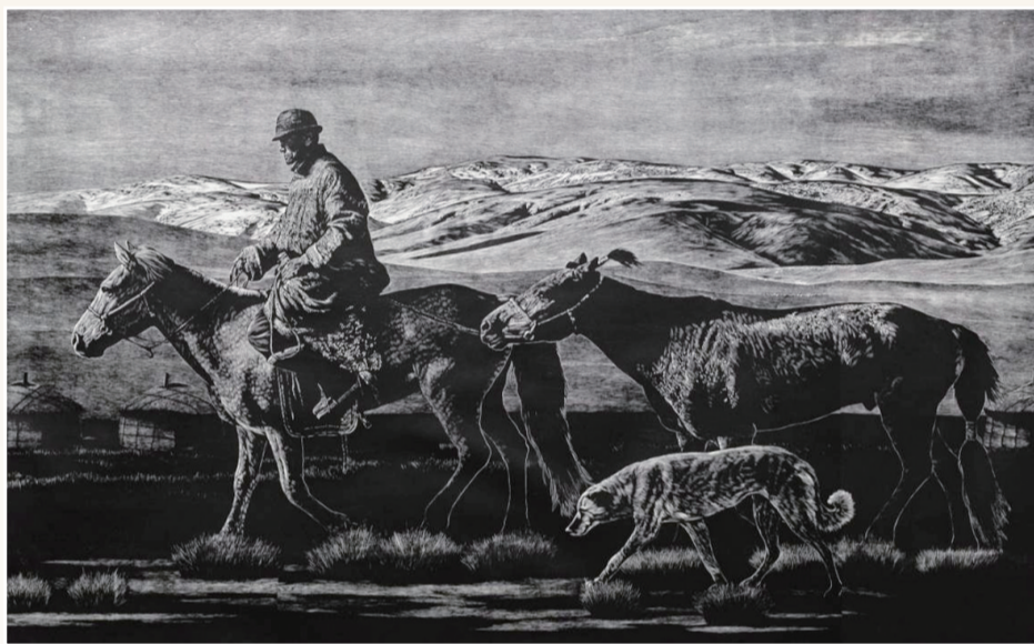
《蒙古高原》黑白木刻 89×136cm 2013年获“第二十届全国版画展”中国美术奖提名(最高奖);荣获第十一届内蒙古艺术创作“萨日纳”奖