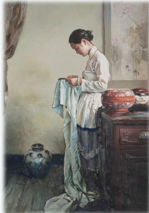
《绣》1996年 116×80cm 浙江美术馆藏

“江南好,风景旧曾谙。日出江花红胜火,春来江水绿如蓝。能不忆江南?”美,来自生活。由浙江美术馆、内蒙古美术馆共同主办的“风景旧曾谙——潘鸿海油画艺术展”于7月25日至8月17日在内蒙古美术馆7、8号展厅展出。