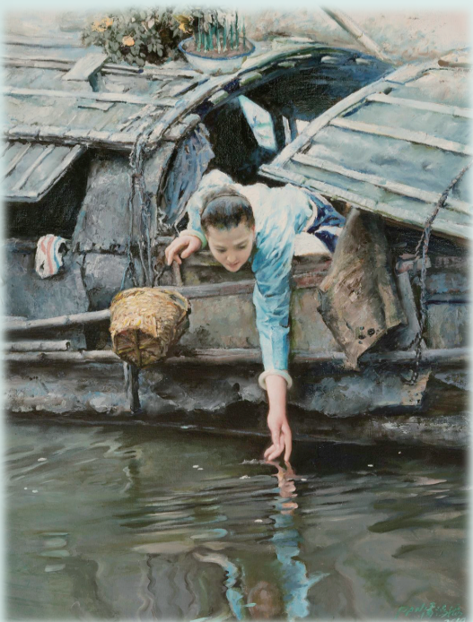
《水上人家》2010年 200×81cm 浙江美术馆藏

本次巡展走入内蒙古,不仅是艺术展览的地域延伸,更是一场跨越南北文化差异的审美对话。江南水乡的柔美意境与北方草原的辽阔壮美形成鲜明对比,潘鸿海笔下的小桥流水、粉墙黛瓦,不仅能唤起观众对江南风物的神往,也将激发对本土文化的认知与思考。这场展览在地域之间架起一座审美的桥梁,推动着东西部美术之间的互动互鉴。