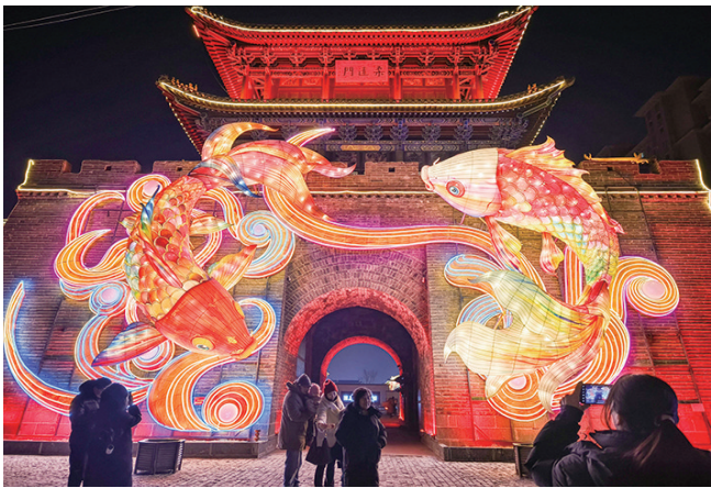
游客在塞上老街旅休闲街区拍照打卡

“过了腊八就是年”,一碗暖乎乎的腊八粥下肚,春节的脚步便愈发临近。2026年春节至元宵节,“呼和如此HOT”新春系列活动将热力启幕,依托青城冰雪资源、南北交融年俗底蕴、厚重文博积淀与地道风味美食,呼和浩特整合推出4条春节主题精品旅游线路,市民、游客春节期间来到呼和浩特,按照这几条线路游玩准没错。