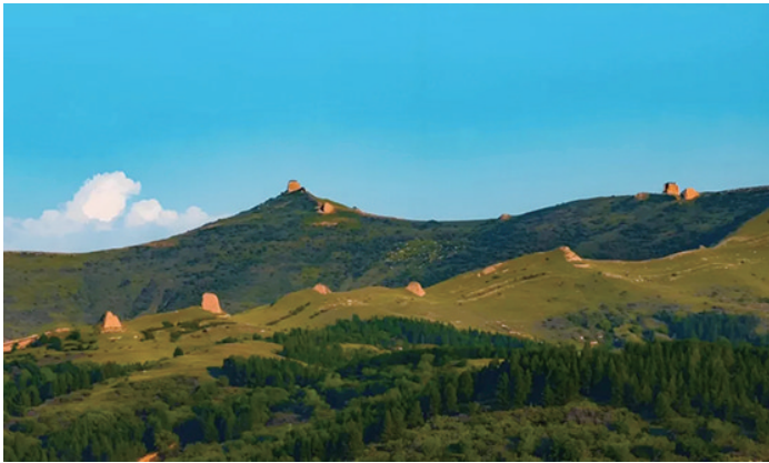
清水河县明长城小元郭段

如今,呼和浩特的文物工作已形成全链条布局,从考古发掘到保护修复,再到展览展示、创新传承,每一环都彰显着对历史文化的敬畏与传承。在壁画保护领域,与敦煌研究院合作共建工作站,对多座古召庙壁画进行科学修复。在理论研究方面,举办系列高规格学术会议,出版多部重要著作,为文化传承夯实学理基础。千年遗珍在新时代焕发出蓬勃生机,为城市发展注入深厚文化底气。