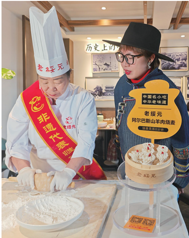
游客体验烧麦制作

内蒙古博物院中文物静静陈列,诉说千年过往;将军衙署博物馆的红墙黛瓦间,尽显清代边疆官署的文化底蕴;宽巷子里市井烟火气十足,能感受老呼市的生活本真。逛至饥肠辘辘,中国烧麦美食街的地道风味正候着,