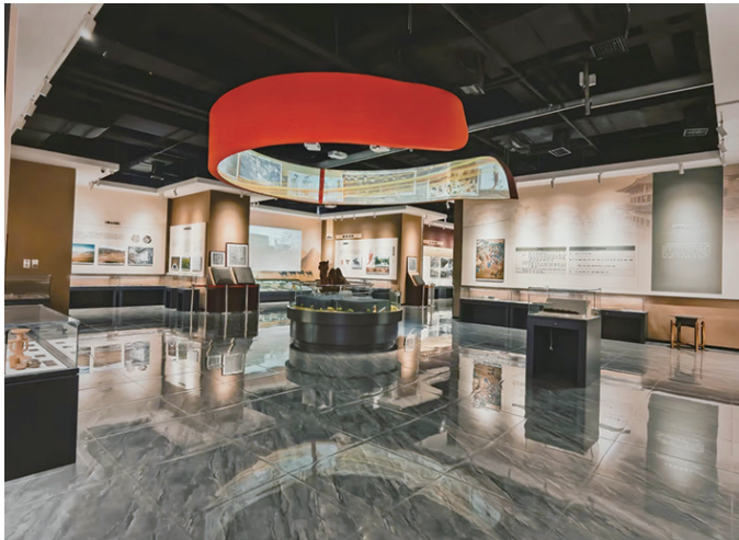
新城区长城文化博物馆