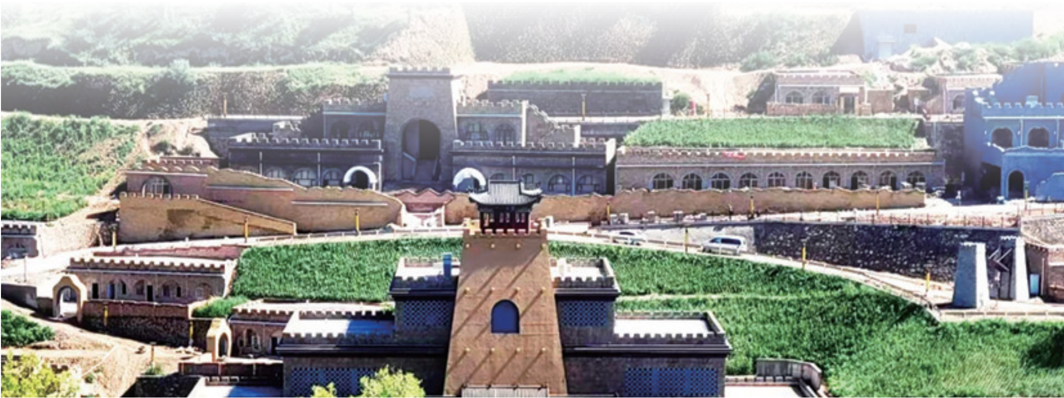
清水河县好汉山明长城国家文化公园

2025年9月16日,大窑遗址考古成果展在周口店遗址博物馆开幕,来自呼和浩特的89件珍贵文物首次在北京亮相。燧石敲击声与光影交织,将观众带回50万年前,一场跨越时空的文明对话就此展开。这背后,是呼和浩特市近年来秉持“考古先行”理念,全方位推动文物保护、研究、阐释与活化利用的生动实践。