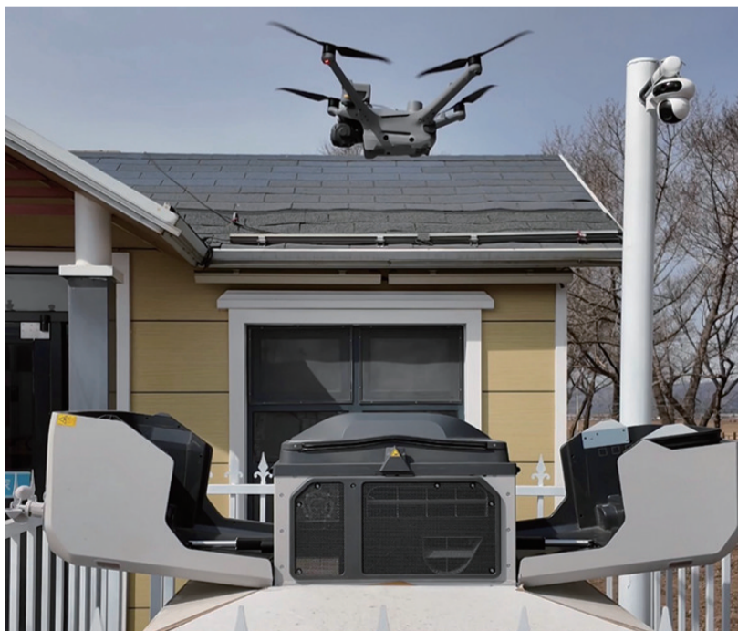
无人机AI智能巡查技术与日常环卫工作深度融合

空地联动更高效,问题处置零拖延。在环卫管控现场,工作人员紧盯屏幕,一旦无人机发现暴露垃圾、乱堆杂物等问题,立刻通过平台派单,附近环卫作业车辆、保洁人员第一时间赶往现场清理,无人车也同步跟