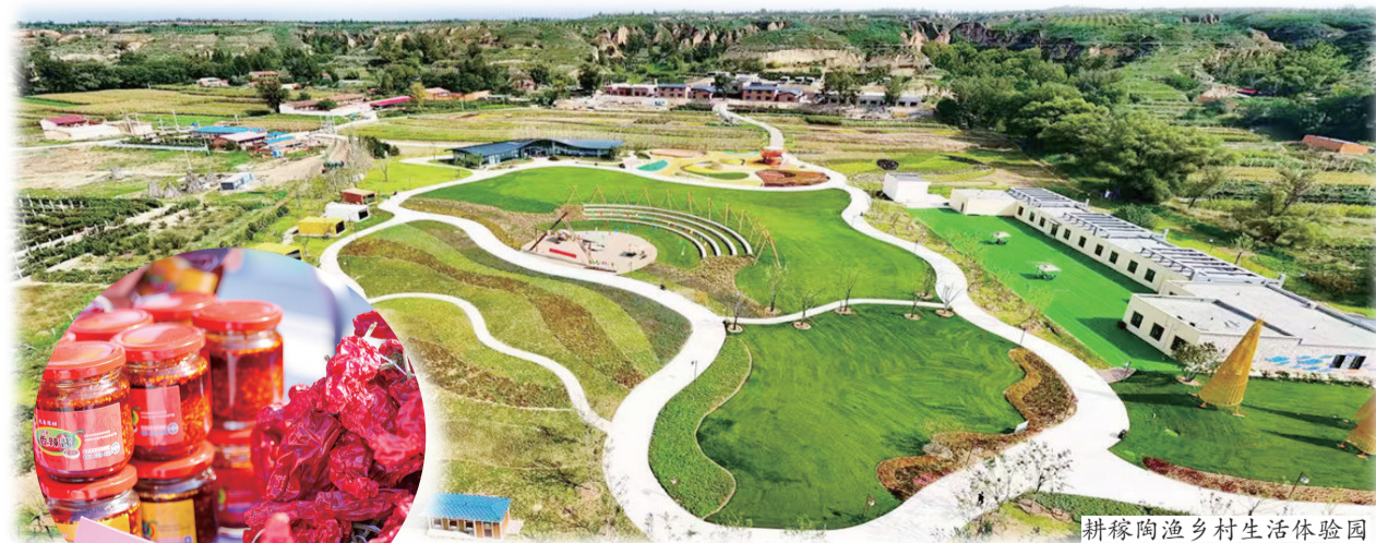
耕稼陶渔乡村生活体验馆

“凭借‘看黄河、摘葡萄、吃炖鱼’的特色体验,郝家窑村从普通村落成长为全国乡村旅游重点村,还先后荣获‘中国美丽休闲乡村’‘全国文明村镇’等国家级称号。”春季以来,郝家窑村主要负责