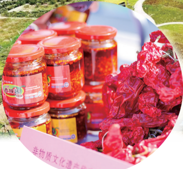
托克托县灯笼红辣椒