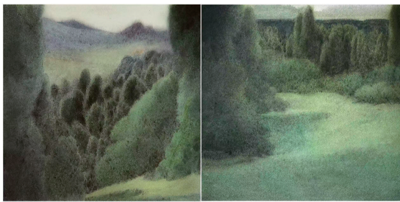
《风随草木具无边》纸本水彩 19.5cm × 35cm 2025年10月