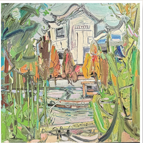
《河道之二》布面油画 100cm × 100cm 2024年

4月14日,由内蒙古师范大学美术学院、银川市文化旅游广电局主办,内蒙古师范大学美术学院美术馆、银川美术馆承办的“行走边界——银川美术馆馆藏朝克巴图作品展”在内蒙古师范大学美术学院美术馆开展。