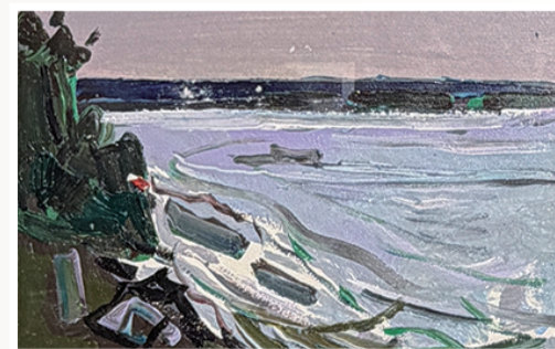
《伏尔加河之夏》纸板丙烯 19cm × 29cm 2024年

展览名称:行走边界——银川美术馆馆藏朝克巴图作品展 展览时间:2026.4.14—5.13 展览地点:内蒙古师范大学美术学院美术馆