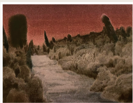
《星火》纸本水彩 31cm × 40cm 2023年1月