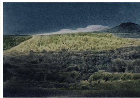
《青草离离》纸本水彩 36cm × 51cm 2022年12月