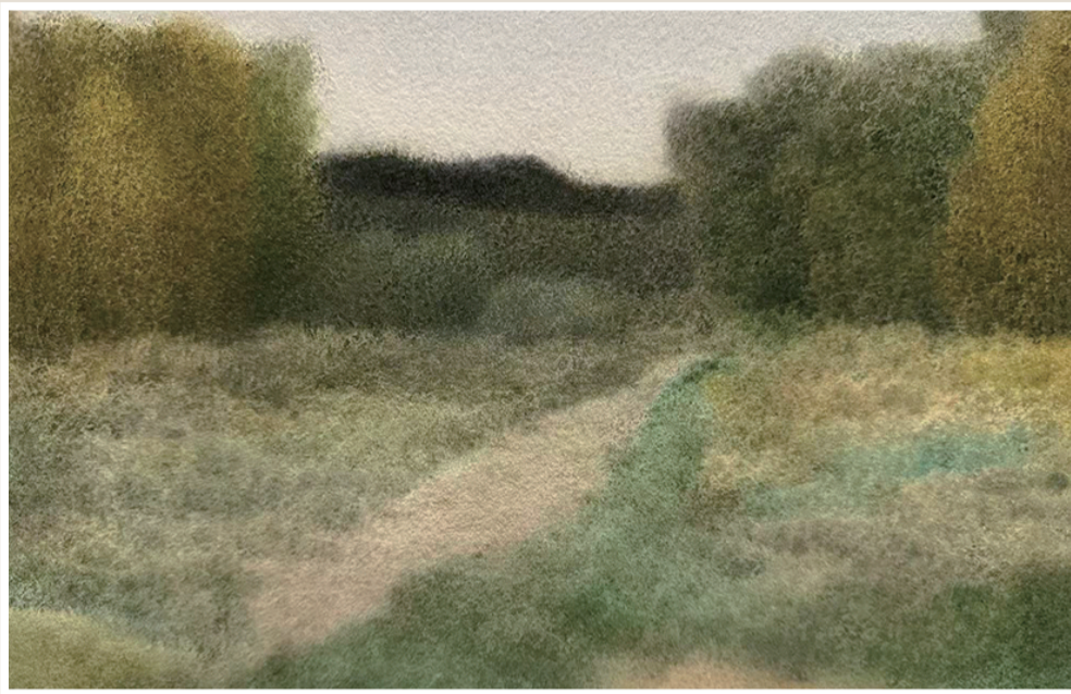
《卉木如姿》纸本水彩 35cm × 102cm 2025年10月

当然,以上的作品分析并不是说柳迪的水彩艺术是完美的,事实上也并不存在完美的艺术。而是意指柳迪在水彩创作上找到了比形式语言和绘画技法更为本真的东西,即艺术表达的性灵与审美体验的呈现。柳迪的绘画说明了这样一个在艺术哲学层面上的问题,形式语言的目的必须指向一个审美世界的建立。人们常用“美”来评价或说明一件艺术品的价值或意义,其背后的逻辑其实是,我们之所以在某类作品中感