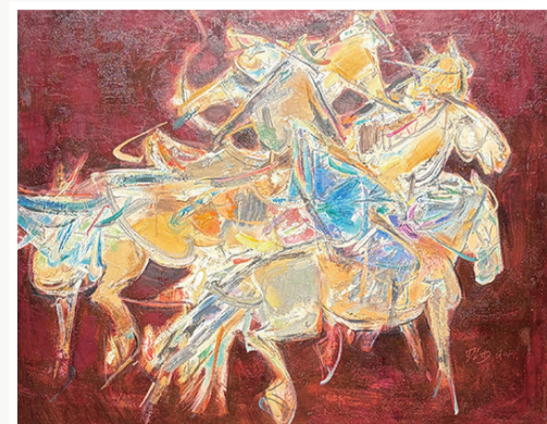
《骑射》布面油画 80cm × 100cm 2014年