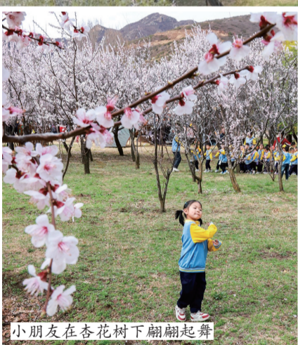
小朋友在杏花树下翩翩起舞