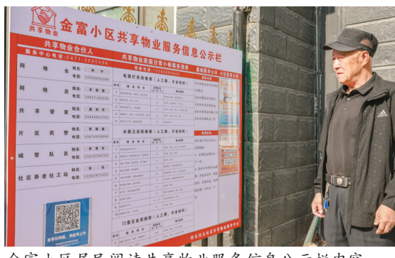
金富小区居民阅读共享物业服务信息公示栏内容

从“管不到位”到“服务贴心”,阿吉拉沁社区用共享物业模式走出了老旧小区治理新路径,办好了群众身边的每一件“关键小事”。