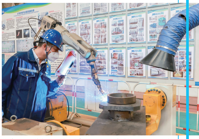
内蒙古纳顺装备工程(集团)有限公司工人察看机器人焊接进度