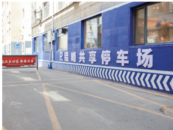
水文华阳小区错峰共享停车场

未来,回民区将构建“春赏花、夏野趣、秋采摘、冬嬉雪”四季休闲全周期文旅格局,打造赏花全季步步皆景、露营休闲山野度假、秋日采摘田园尝鲜、艺术文创沉浸式体验、特色民宿野栖居五大业态,以花为媒、以景待客、以情留客,把生态优势转化为发展优势,把乡村“颜值”变现为经济价值,让杏花成为带动乡村发展的“致富花”,让乡村旅游成为乡村振兴的“新引擎”。