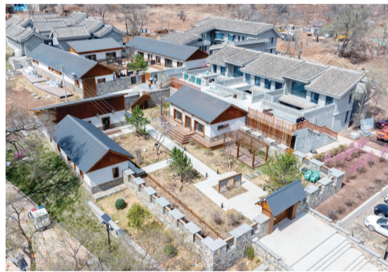
攸攸镇蒙家沟村和美乡村示范项目

从老呼钢到纳顺集团,变的是企业名称、生产规模,不变的是扎根实业、匠心筑梦的初心。如今的纳顺集团,布局多个生产基地,在矿热炉装备制造领域深耕细作,成为回民区老工业基地转型升级的生动样本。