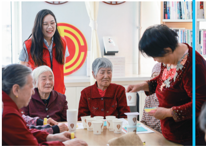
环河街办事处阿吉拉沁社区居民正在做游戏

如今的水文华阳小区,道路干净整洁,车辆停放有序,绿植修剪整齐,居民们茶余饭后在小区里散步聊天,其乐融融。“自从实行错峰停车,小区环境变好了,服务到位了,我们住着舒心多了!”居民们的话语里,满是获得感与幸福感。从“脏乱差”到“洁净美”,从“治理难”到“善治理”,水文华阳小区以小小的停车位为抓手,盘活闲置资源、破解治理难题,成为回民区基层治理创新的生动缩影。