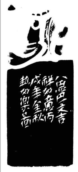
艺如乐园《吉祥如意》(八思巴文) 4.3cm×4.4cm