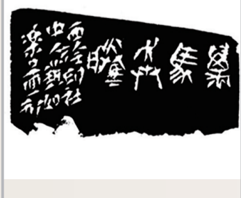
艺如乐园《万马奔腾》(八思巴文) 6cm×5.6cm