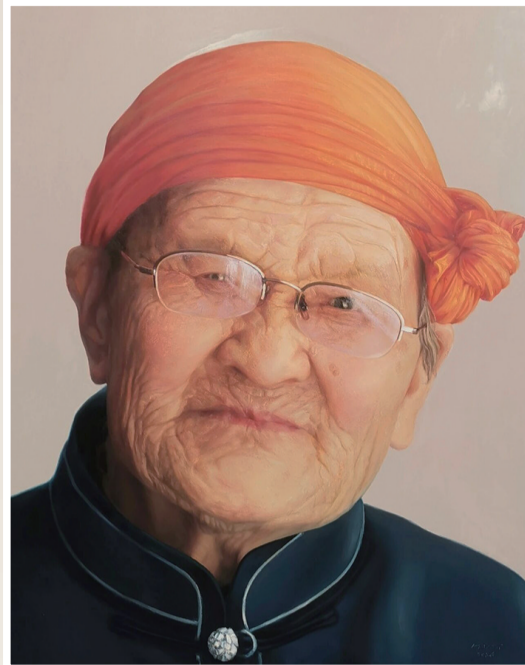
《人民楷模——都贵玛》250cm×200cm 2026年

劳动,是文明的基石,是时代前行的力量,更是镌刻在大地与人心之上的永恒诗篇。在艺术的长河中,对劳动者的描绘,始终承载着对生命本真的敬意与对时代精神的追寻。由内蒙古美术馆、内蒙古美术家协会主办的“劳动者之歌——何永兴油画作品展”日前在内蒙古美术馆展出,展览以画家数十年深耕现实主义的创作为脉络,用厚重而温暖的油画语言,为平凡而伟大的劳动者立像,讴歌质朴而坚韧的劳动精神。