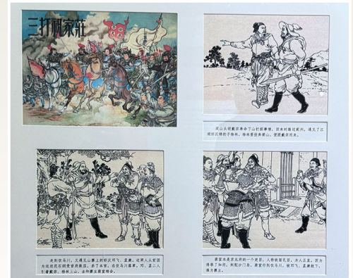
徐燕孙绘《三打祝家庄》大众图画出版社1950年8月1版

本次展览将持续至5月19日,主办方诚邀广大市民、艺术爱好者及青少年朋友,走进呼和浩特市美术馆,徜徉百年连环画艺术长河,在经典作品中感受传统艺术魅力,厚植文化自信,共赴一场跨越百年的艺术之约。