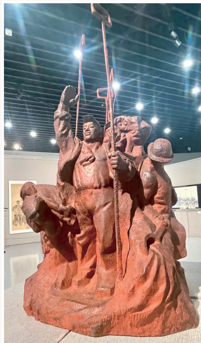
要鸿鹏作 雕塑《钢铁工人有力量 齐心协力建包钢》180cm×90cm×90cm