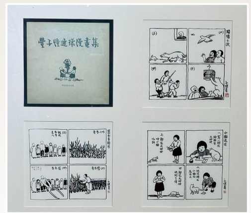
丰子恺绘《丰子恺连环漫画集》名窗出版社1979年10月1版

为让经典“活”在当下,展览创新打造沉浸式观展体验:现场设置多媒体借阅屏,指尖轻触即可数字阅读经典连环画,实现艺术与科技的深度融合;特设连环画集章台,可收集《山乡巨变》《丰子恺连环漫画集》等定制印章,收藏艺术印记;还布置了主题拍照