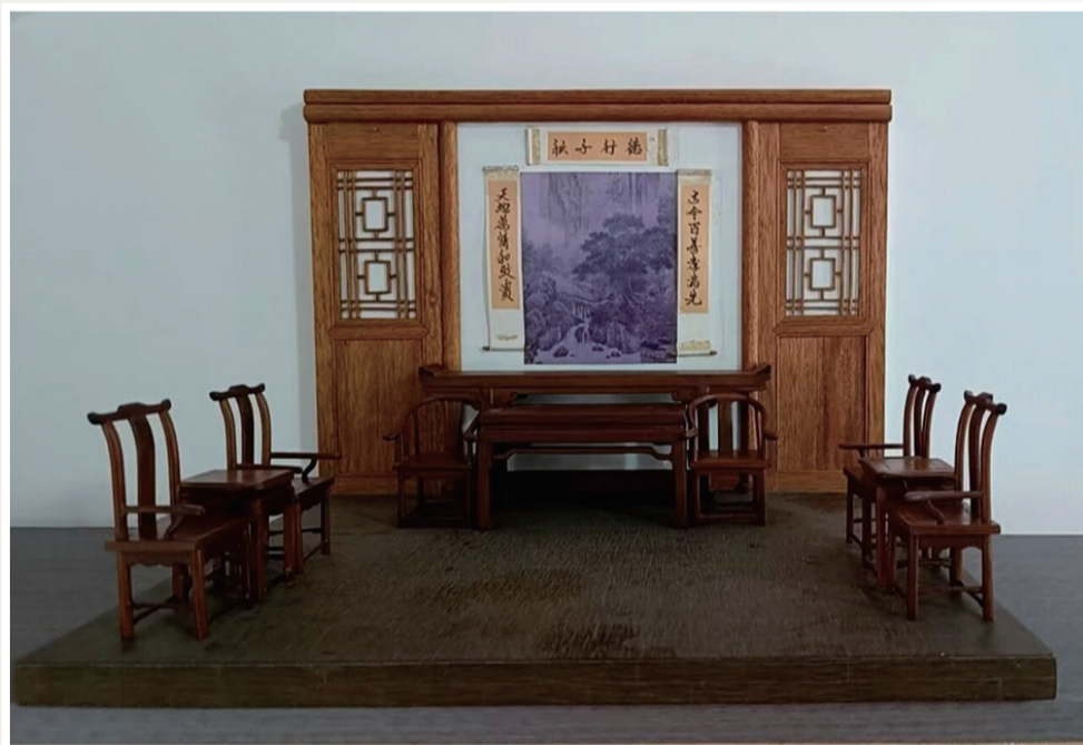
要福正作 微缩木艺 中堂 40cm×25cm×30cm