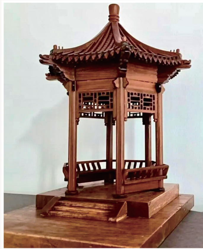
要福正作 微缩木艺 六角亭 19cm×25cm×30cm

“这次展览呈现的是我们儿时的梦想,是我们一路走来的艰辛耕耘,是几十年对艺术孜孜以求的回望,更是一份对艺术真诚的热爱之情,也是我们姐弟四人给敬爱的父母一份迟到的汇报,更是对各位师长真诚的致谢。我们自知作品尚有诸多不足,远未达到理想的艺术水准和境界,在此真诚希望与敬爱的老师、可爱的同道和朋友们交流,非常期待得到大家的指正。”要红宇向媒体诚恳地说。