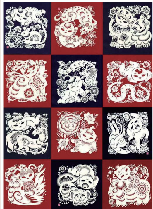
要红霞作 剪纸《天生一对·童心常在·十二生肖》110cm×80cm