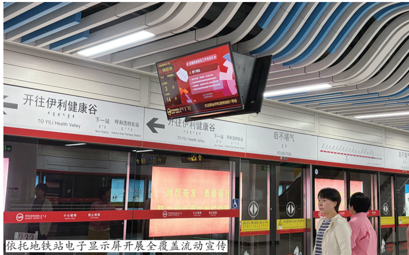
依托地铁站电子显示屏开展全覆盖流动宣传

线上宣传多点覆盖,拓宽普法传播渠道。依托青橙融媒App、呼和浩特阳光信访微信公众号等平台,集中推送信访工作法治化主题宣传短视频、普法图文海报,系统解读《信访工作条例》核心内容、信访办理流程、合法维权途径及违法信访行为法律后果,以通俗易懂、直观生动的形式,让信访法规知识走进群众、融入生活,切实扩大线上普法覆盖面和影响力。今年以来,累计推送宣传短视频、图文等125条,点击量达169万余人次。