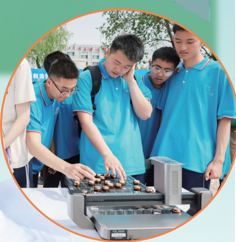
学生在活动现场和机器人下棋