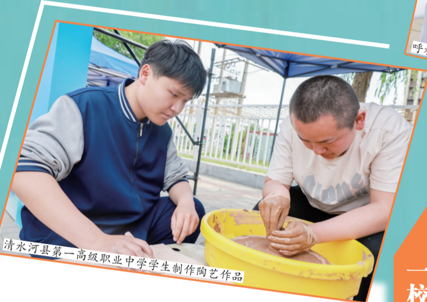
清水河县第一高级职业中学学生制作陶艺作品

从非遗美食传承到新兴技术攻坚,从乳业全链条服务到现代服务业升级,呼和浩特职业院校始终坚持“专业跟着产业走、课程围着岗位转、实训贴着需求办”办学思路,因地制宜深耕产教融合特色办学,既夯实技能人才培育根基,又为本土产业稳健发展筑牢人力支撑。