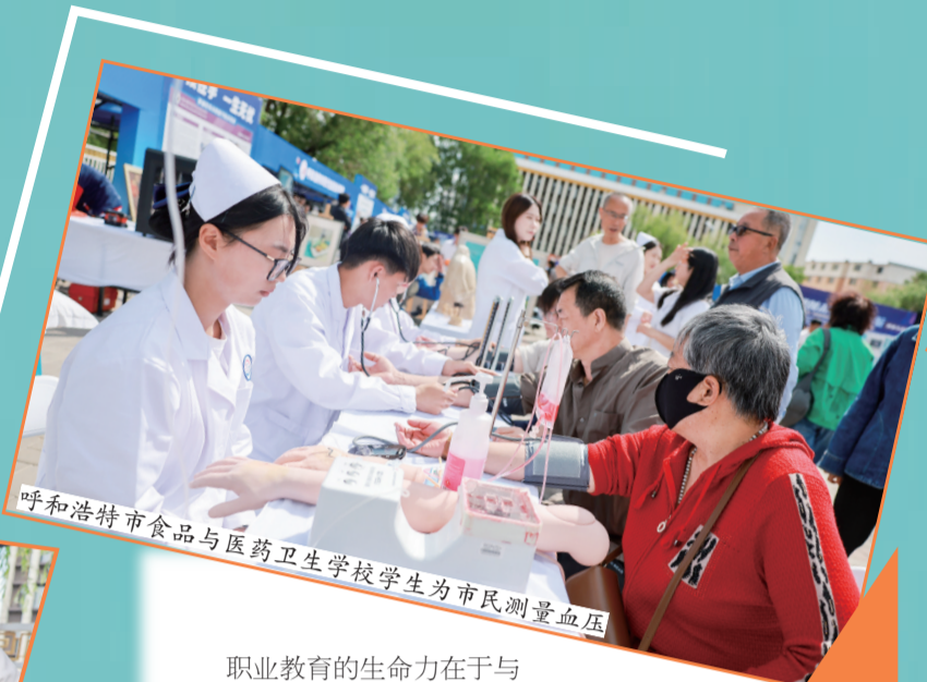
呼和浩特市食品与医药卫生学校学生为市民测量血压

呼和浩特多年锚定职业教育服务地方产业发展定位,持续深化职教领域改革,在一系列政策与投入的支撑下,职业教育正实现跨越式转型。从被动适配产业需求到主动支撑产业升级,从人才输血到价值造血,呼和浩特职业教育以体系更完善、专业更精准、融合更深入、服务更全面的扎实成效,不断提升对地方经济社会发展的贡献度,并以深度产教融合为纽带,以特色化、高质量发展为路径,持续为“六大产业集群”建设提供坚实人才支撑与智力保障,在服务自治区首府高质量发展进程中书写从适配到支撑、贡献度持续跃升的育人新篇章。