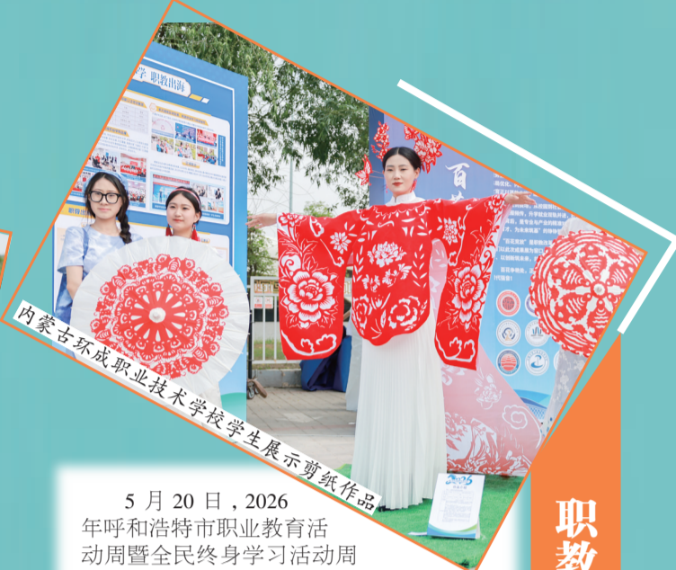
5月20日,2026年呼和浩特市职业教育活动周暨全民终身学习活动周在内蒙古展览馆启动。活动以“一技在手,一生无忧”为主题,全市18所职业院校集中亮相,通过成果展示、技能展演、非遗体验、创客互动、便民服务等多种形式,全方位呈现呼和浩特职普融通、产教融合、科教融汇的发展成效,让社会各界近距离感受职业教育的活力与魅力。