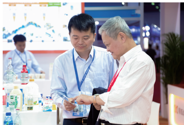
◀中国乳制品工业协会理事长、国际乳品联合会中国国家委员会主席吴秋林(右)与参展企业代表交流互动