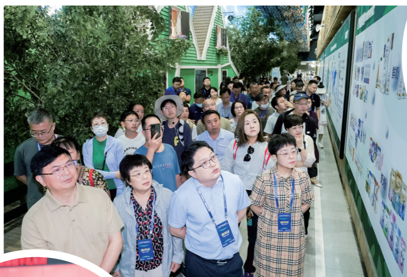
▲了解蒙牛集团发展史