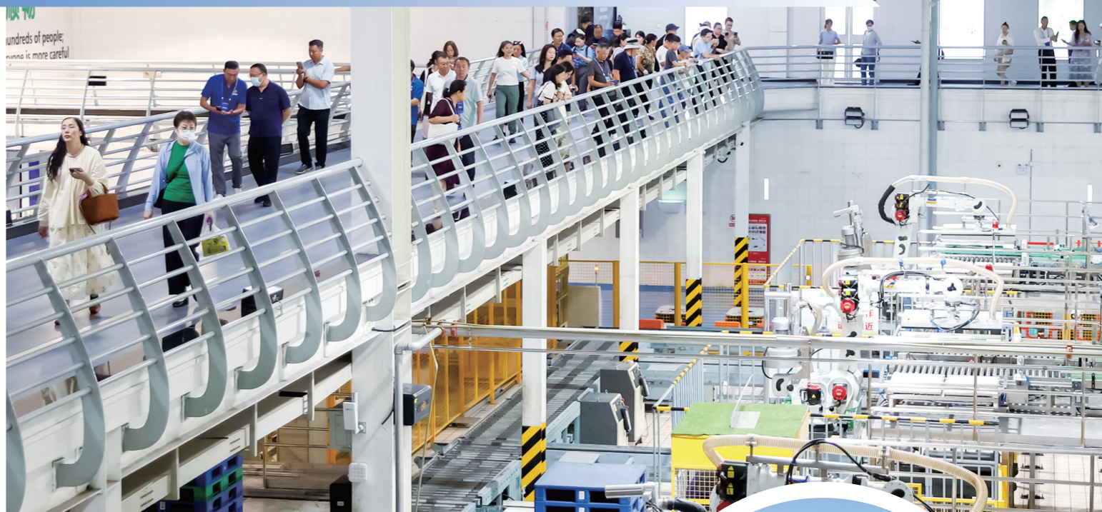
▲蒙牛六期工厂智能化生产线