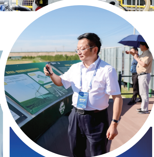
▲参观蒙牛现代草业台基营村苜蓿种植基地