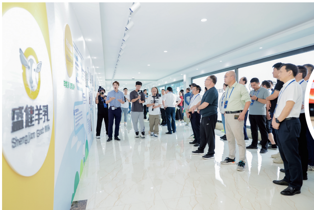
▲了解盛健羊乳全产业链发展布局