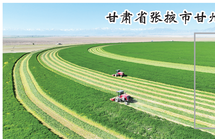
甘肃省张掖市甘州区大型饲草收割机采收紫花苜蓿

(本报所采用部分文图无法联系到作者,请相关著作权人持权属证明与本报联系,本报将支付稿酬。)