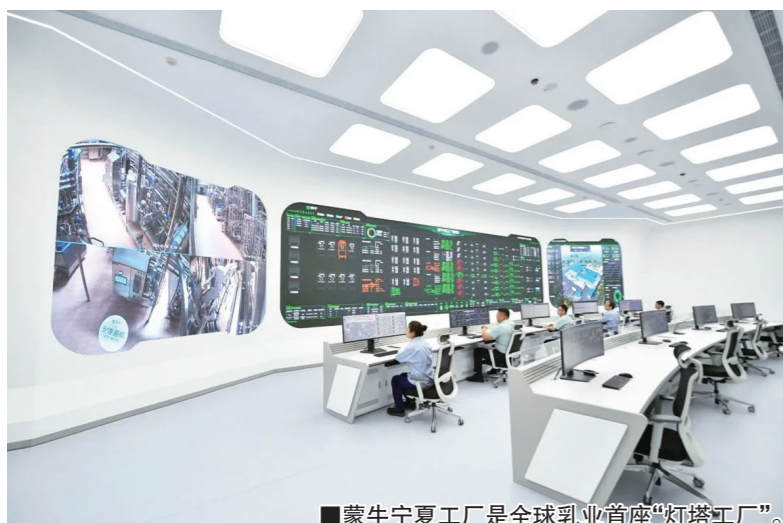
■蒙牛宁夏工厂是全球乳业首座“灯塔工厂”。