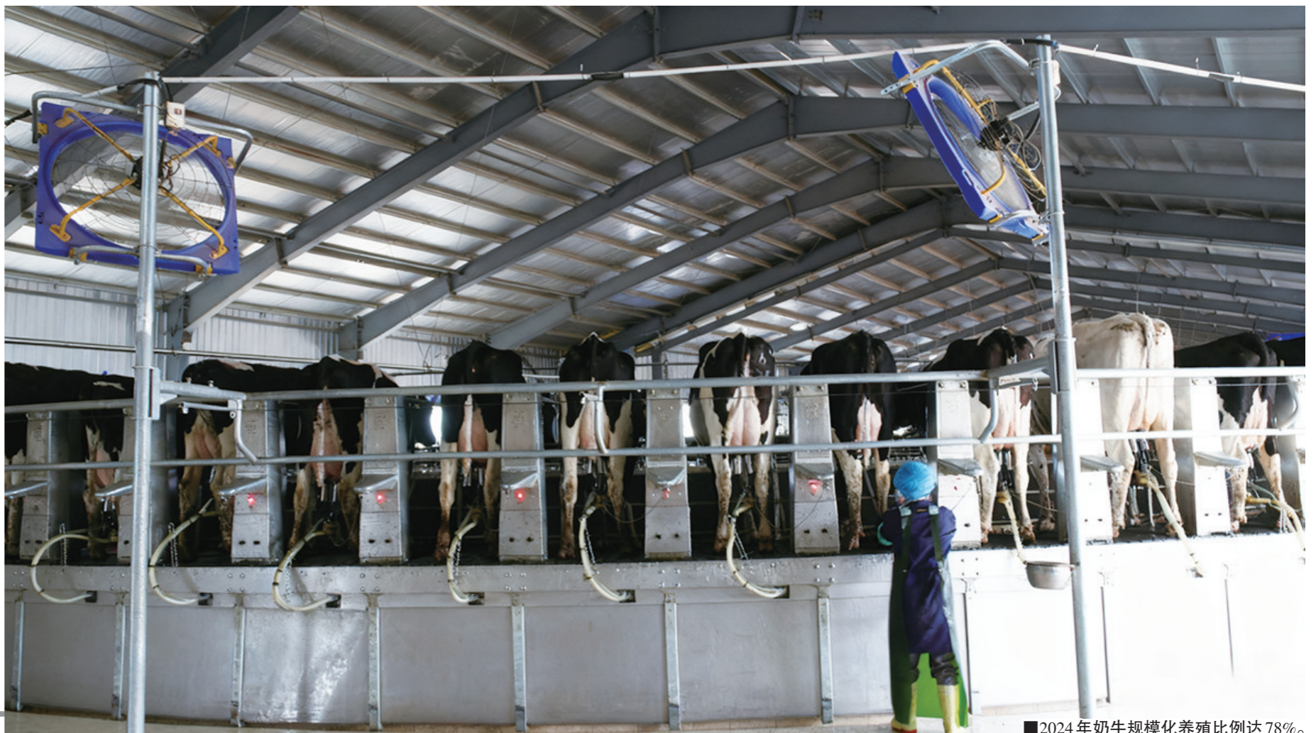
■2024年奶牛规模化养殖比例达78%。