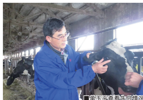
单玉平查看牛只情况