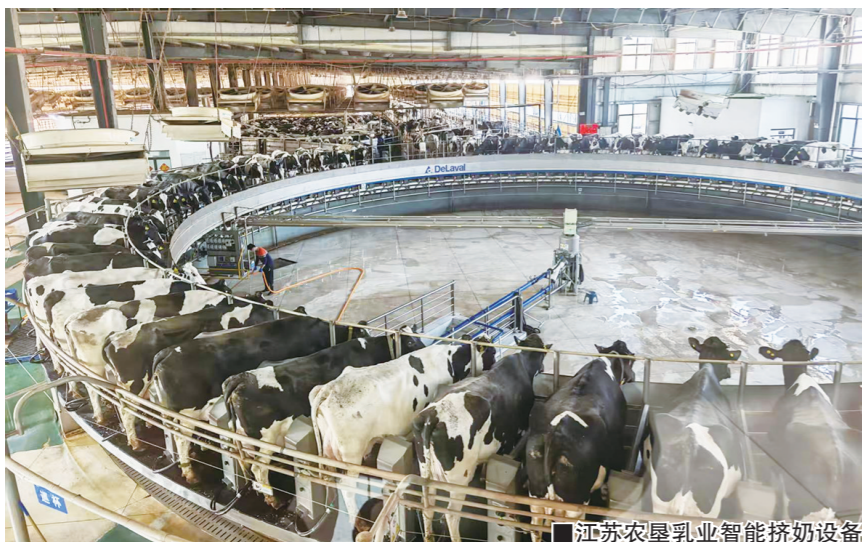
江苏农垦乳业智能挤奶设备

当前,中国奶业正经历从规模扩张向质量效益转型的关键阶段,产业链整合与价值链提升成为区域奶业破局的核心命题。在这一背景下,连云港奶业呈现出一个鲜明而典型的样本:前端养殖实力突出——规模化率高达98%、智慧养殖技术领先、生鲜乳产量稳居江苏省第二;但中后端加工与品牌市场严重缺失,超过80%的原奶不得不作为原料外运,陷入“养强加弱、价值外流”的产业困局。