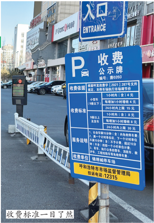
收费标准一目了然