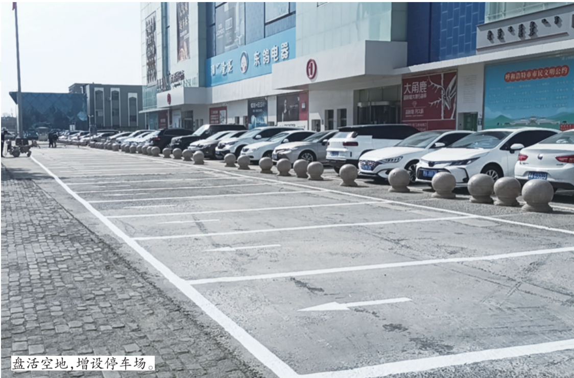
盘活空地,增设停车场。