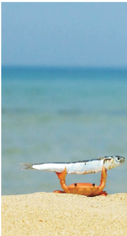
许多动物都喜欢集体活动