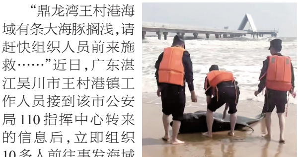
鼎龙湾王村港海域有条大海豚搁浅，请赶快组织人员前来施救……

近日，广东湛江吴川市王村港镇工作人员接到该局110指挥中心转来的信息后，立即组织10多人前往事发海域施救，最终将海豚成功护送回大海。