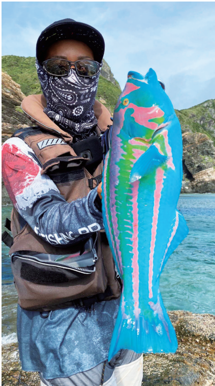
五颜六色好像在油漆里泡过的鱼