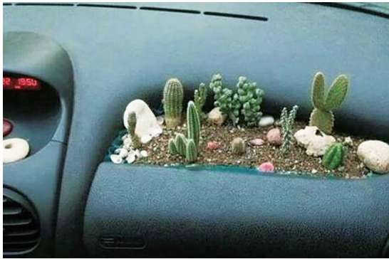
你确定操作台手扣是这种用途?