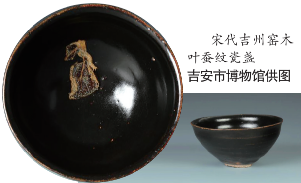
宋代吉州窑木叶纹瓷盏

在近日江西省吉安市博物馆系统馆藏的“十大文物珍品”评选活动中,宋代吉州窑木叶蚕纹瓷盏引起关注,这只黑釉木叶盏上的桑叶纹与蚕纹巧妙组合,在国内十分罕见。