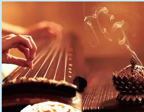
古人通过琴弦松紧判断空气湿度

通常说的空气湿度一般都是指“相对湿度”,它是用空气中实际水汽压与当时气温下的饱和水汽压之比的百分数表示,百分数越大,表明空气湿度越大。现在的我们,用一支空气湿度计就可轻松松知道空气湿度,用一台除湿器就可以缓解不舒适的体感,没有高科技的古代,用什么方法测量空气湿度、应对潮湿天气呢?让专家带你“穿越”到过去,看看古人是怎么做的。