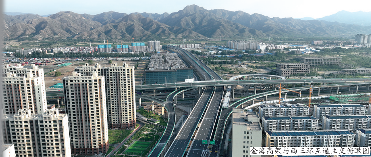
金海高架与西三环互通立交俯瞰图

域的路网结构,更主要的是有效缓解了毫沁营区域以及内蒙古妇幼保健院周边日益突出的交通问题,为周边市民和就医患者提供了更加便利的出行条件。