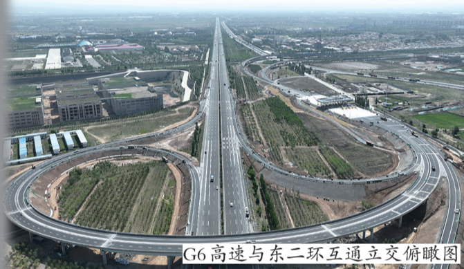
G6高速与东二环互通立交俯瞰图

市民驾车到达东二环快速路后,一直向北到达G110国道与东二环交叉口就可以通过互通立交到达东二环高速出入口,实现高速公路与城市快速路之间的无缝通行,全线没有红绿灯。