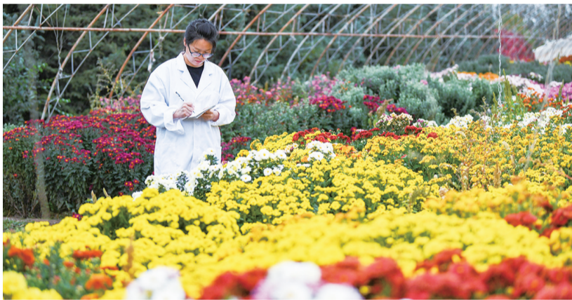
冬季,技术科研人员在大棚内观察室外美化用花的长势情况。