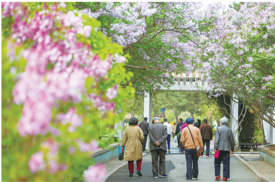
春末的丁香花让人流连忘返(春季拍摄)

如今,首府打造的敕勒川草原花海、大黑河马鞭草花海……大地仿佛成了一片色彩斑斓的海洋,吸引着无数游人前往感受大自然的的魅力。遍布在我市各大公园里的荷花、芍药花等也娇艳盛开,畅游其中,令人陶醉。不论是摄影爱好者、自然爱好者还是文化探索者,都能在这里找到属于自己的心灵净土。这个夏天,快来呼和浩特畅游花海吧。