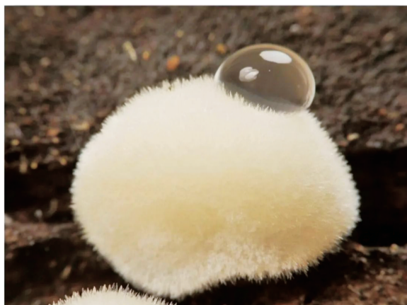
风雨之后出现的真菌幼体，看起来有点萌