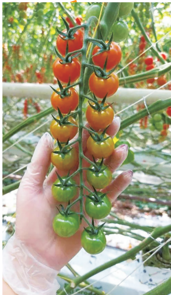
番茄们生长很有秩序