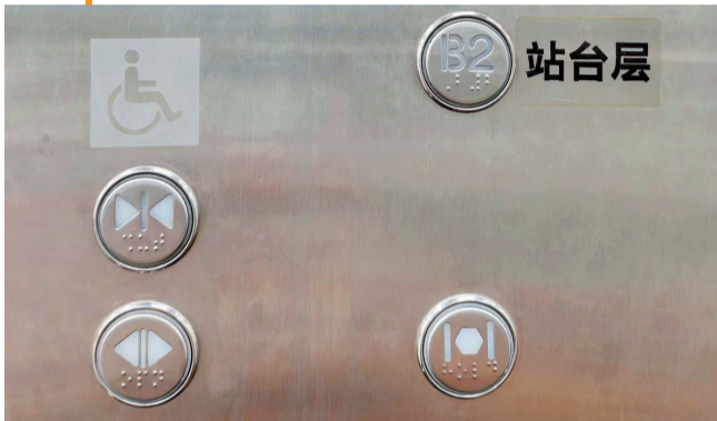
地铁站内直梯按键也设有盲文标识

呼和浩特晚报讯(记者 杨志伟)在呼和浩特提及地铁,可谓妇孺皆知,很多人都有过乘坐地铁、感受其便利的经历。可是,忙于出行的您,是否留意到地铁站手扶电梯及扶梯旁边栏杆扶手处刻着的一些由金属小圆点组成的符号?别小瞧这些不起眼的金属小圆点,作用大着呢!