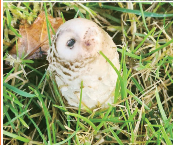
不是猫头鹰,是蘑菇。