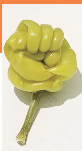
辣椒看起来像拳头