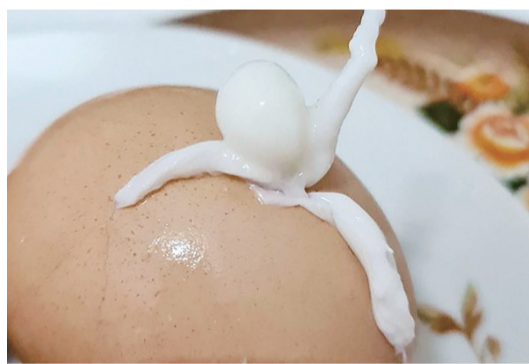
鸡蛋煮过头,似乎有一个人正试图从里面爬出来。