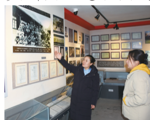
讲解员介绍多松年烈士生平