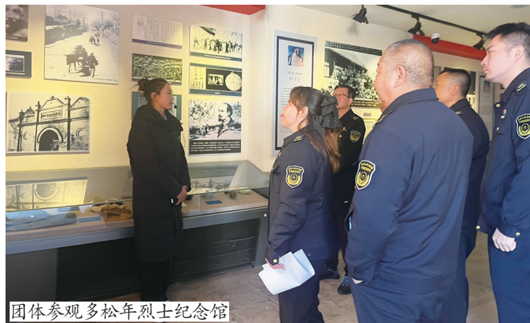
团体参观多松年烈士纪念馆