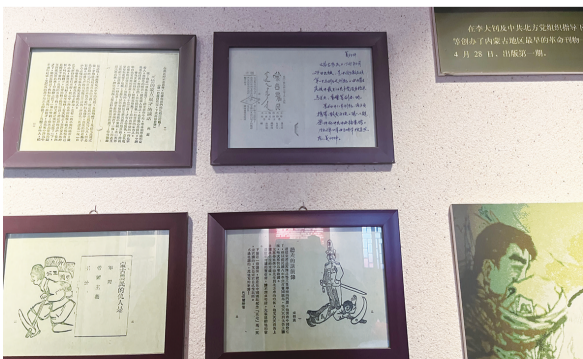
多松年烈士纪念馆一角

“当时，多松年和他的爱人住在里间，多松年的父母住在外间，其他的兄弟姐妹在另外的房间居住。里间只有一铺炕、炕桌等简单的生活用品，生活是很简朴的……这是多松年上学时的成绩单和毕业照，这是1925年多松年同乌兰夫等同志创办的革命刊物《蒙古农民》，为了进行反帝反封建革命宣传，他本人任编辑和发行人，这也是中国共产党历史上第一份少数民族革命刊物……虽然他牺牲时只有22岁，但是却留下了很宝贵的精神财富……”伴随着讲解员的介绍，多松年烈士的形象也变得立体、丰满了起来。