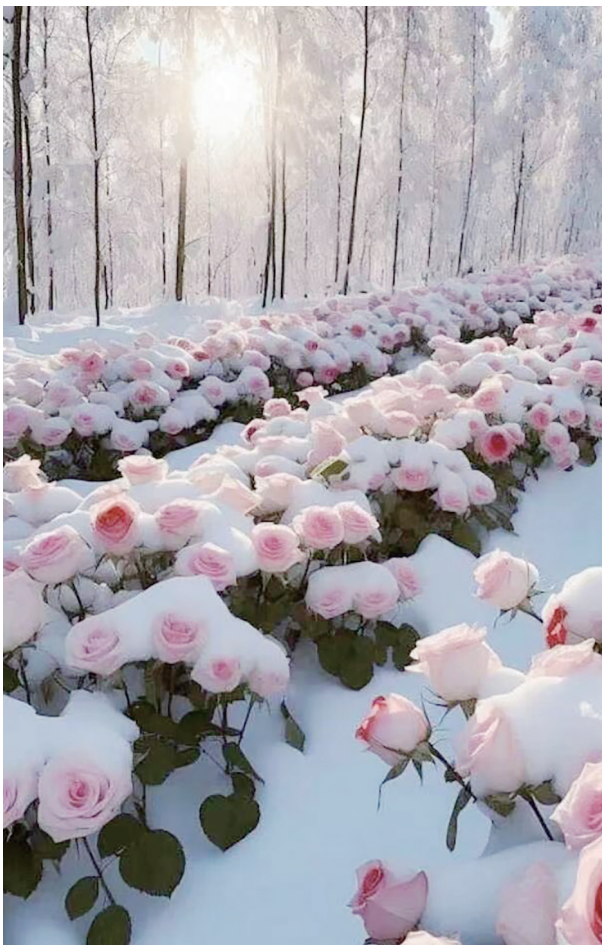
雪中花，别有一番美丽。