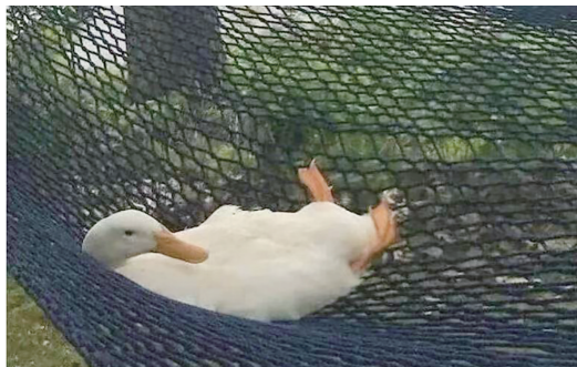
天气不错，我先躺平一会儿。