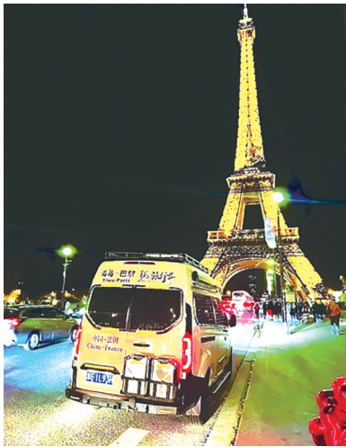
每年一半时间工作 一半时间出行