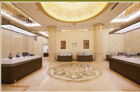
呼和浩特博物馆展厅