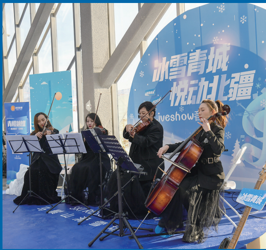
“乐”动北疆主题音乐会现场