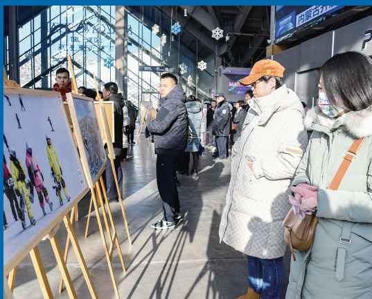
游客观看现场摄影展