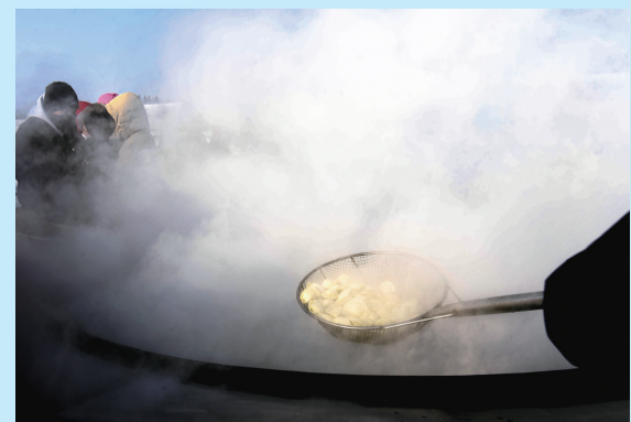
热腾腾的饺子出锅啦