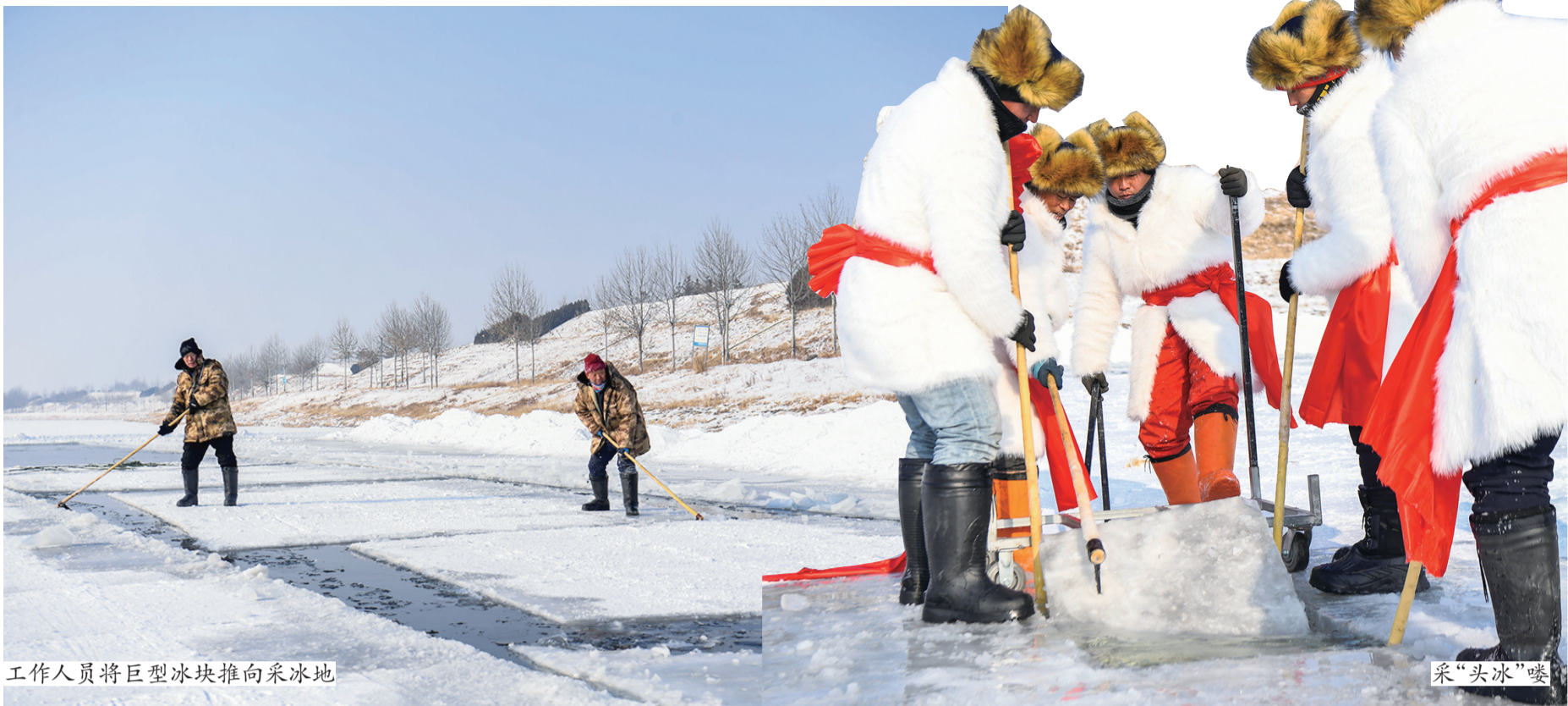
工作人员将巨型冰块推向采冰地