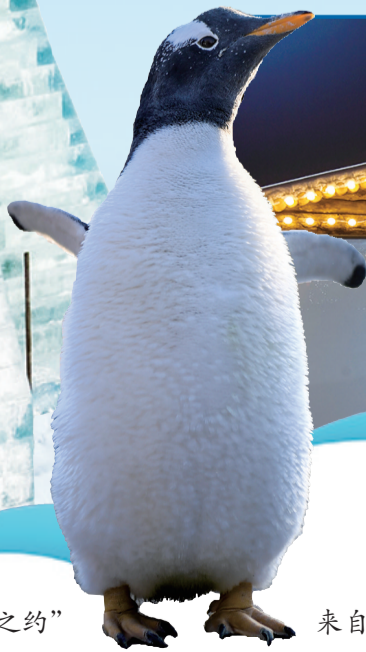
来自巴布亚的企鹅等你来拍照哦