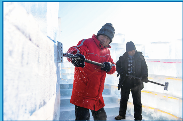
每一块冰都需要精雕细琢