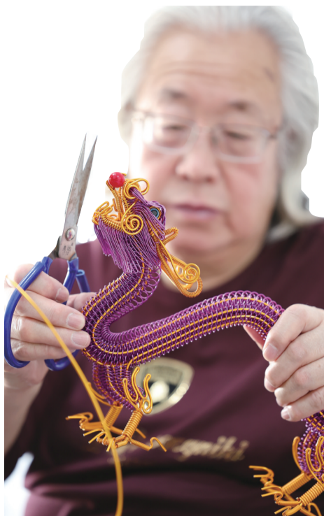
金属丝编是一项细致活