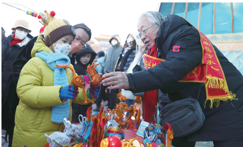
作为非遗项目，金属丝编受到市民尤其是孩子们的喜爱