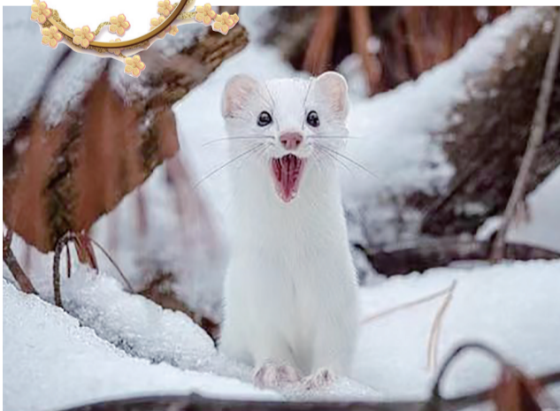
这只小动物还挺可爱