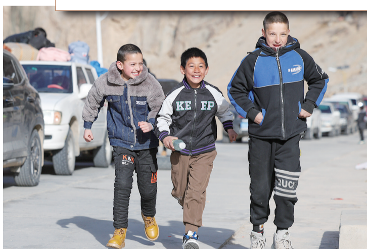
在新疆叶城县西合休乡巴什却普村，西合休乡中心小学的学生等候上学车队出发。