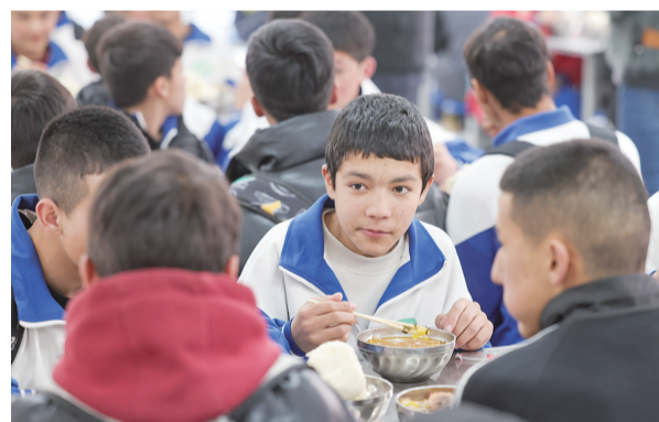
历经六个小时左右，西合休乡初中生返校的车队抵达叶城县第十五中学，学校食堂早已为学生准备好晚饭。