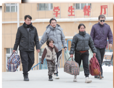
在西合休乡中心小学，三位老师帮助刚抵达的学生和家长提着行李走进校园。