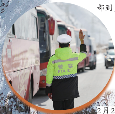
2月26日，由警车开道、救护车随行的上学车队穿行在昆仑山区，带着西合休乡的初中生前往县城上学。

又到一年开学季。叶城县一如既往组建了由教育、公安、交通、卫生等部门联合参与的护学队，免费接送西合休乡学生，确保安全返校。