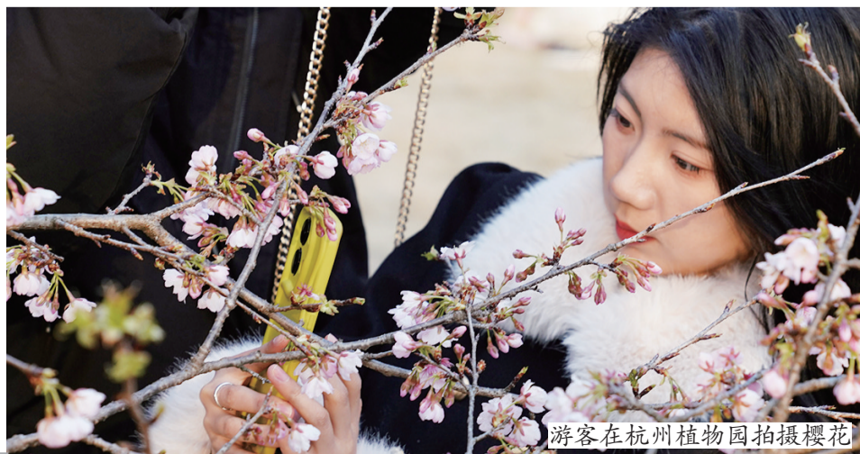
游客在杭州植物园拍摄樱花